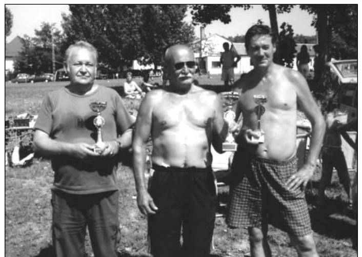
A főzőverseny helyezettjei