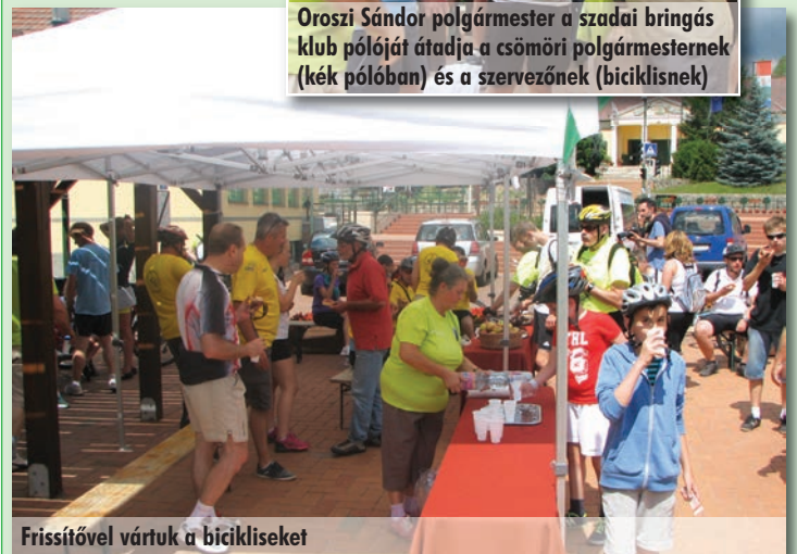
Frissítővel vártuk a bicikliseket