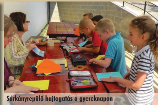
Sárkányrepülő hajtogatás a gyereknapon

Szadáról a Csodák Palotájába, ahol érdekes kísérleti bemutatót, 3D mozi-előadást hallhattunk és játszottunk is nem keveset. Hamar eltelt a délelőtt, 13.00-kor átvitt minket az autóbusz a Városligetbe. Megebédeltünk egy virágos parkban, sétáltunk, fagyiztunk, majd kicsi szabad időt kaptak a gyerekek egy játszótéren. Mászóka, hinta, trambulín... 16.00-kor vissza-indultunk élményekkel gazdagodva, remélve hogy a következő tanévben is részt vehetünk az Aranybusz kiránduláson.