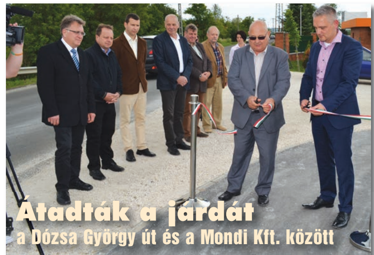
Átadták a járdát a Dózsa György út és a Mondi Kft. között