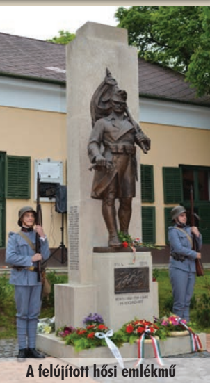
A felújított hősi emlékmű