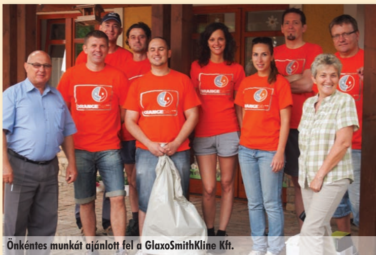
Önkéntes munkát ajánlott fel a GlaxoSmithKline Kft.