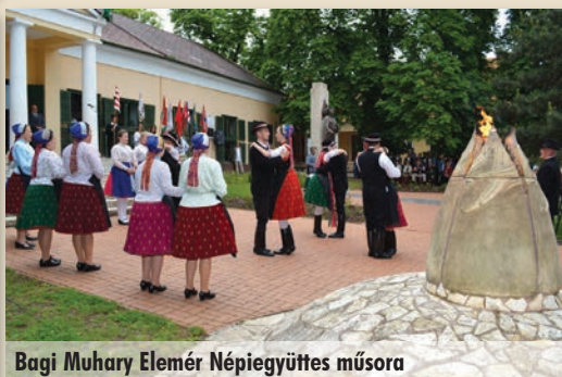
Bagi Muhary Elemér Népiegyüttes műsora