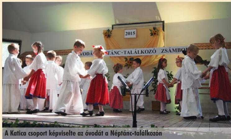
A Katica csoport képviselte az óvodát a Néptánc-találkozó

Május vége az évszázok és a ballagások ideje az óvodában. Mindenki megmutatta mit is tanult egész évben. Volt, aki mesét dramatizált,