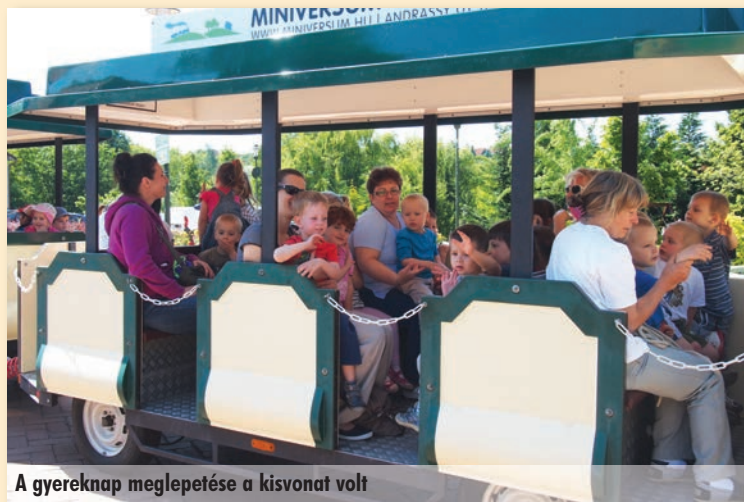
A gyermeknap meglepetése a kisvonat volt