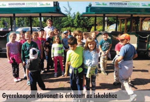
Gyereknapon kisonvat is érkezett az iskolához