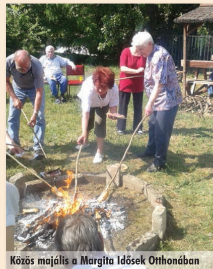
Közös májális a Margita Idősek Otthonában