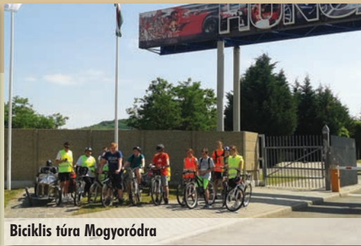
Biciklis túra Mogyoródrá