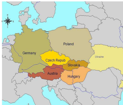
COACH BioEnergy projekt partner országai

A hálózat az Európai Bizottság által támogatott COACH BioEnergy projekt keretében kerül megvalósításra több ország közreműködésével Közép- és Kelet-Európában. A projekt rendszerezi és adaptálja a különböző rangos közép- és kelet európai egyetemek és kutatóintézetek által összegyűjtött információkat, és a térség intézményei, érdekeltjei rendelkezésére bocsátja a projekt keretében létrehozott tanácsadó hálózaton keresztül.