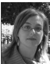
Porteleki Anna Szent István Egyetem Mezőgazdasági- és Környezettudományi Kar

A gazdasági, társadalmi, és környezetvédelmi hatásokat vizsgáló program keretében fórumok szervezésére, kérdőíves felmérések készítésére is sor kerül majd. Kérjük, véleményével tegye Ön is teljesebbé a településéről szóló tanulmányt, és továbbra is kísérje figyelemmel munkánkat, melyről hónapról-hónapra beszámolunk Önöknek.