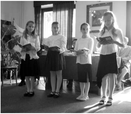
Gyermekműsor köszönti a döntőbe jutottakat

napokba. Örülök a jelentkezőknek, akik nem egyszerű feladatra vállalkoztak, amikor idegen környezetben vállaltak, szakértők bírálata mellett órátartást, ráadásul nem olyat, amit ők választottak, hanem amit a sorsoláson kaptak. Meg kell becsülni az ilyen pedagógusokat!