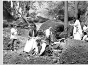
Földanya szertartás a Holdvilág árokban

A fenti események címszavakban tükrözik Egyesületünk sokszínű életét. Egészséges életmód rovatunkban eddig mégis a fő téma, amely köré beszámolóinkat és gondolatainkat rendeztük, életmódunk olyan szervezése volt, ahol a közvetlen kapcsolatban kielé-