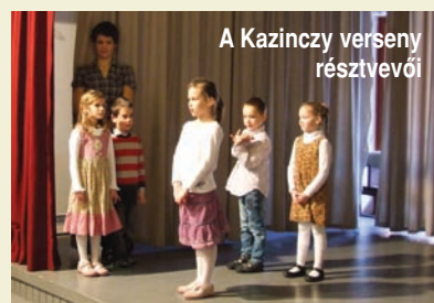
A Kazinczy verseny résztvevői