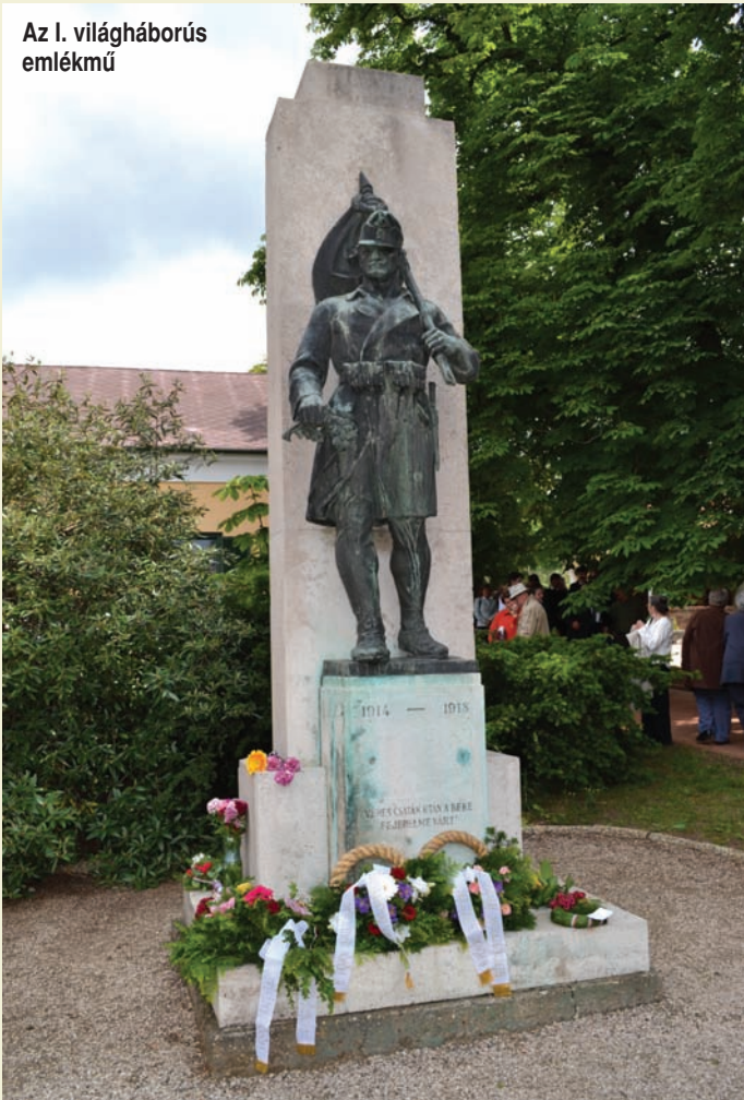
Az I. világháborús emlékmű