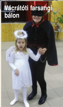
Vácrátóti farsangi bál