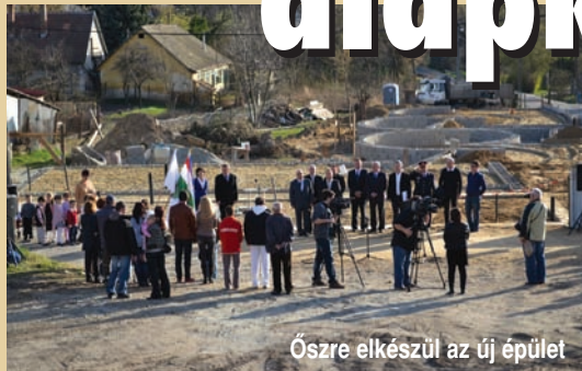
Őszre elkészül az új épület