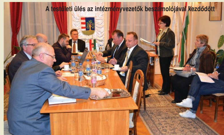
A testületi ülés az intézményvezetők beszámolójával kezdődött