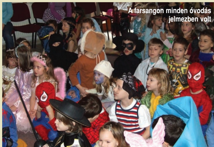
A farsangon minden óvodás jelmezben volt

Február 25-én a Méhecske csoport és a Katica csoport nagyobbjai a Planetáriumban voltak. Mikor szóba jött ez a kirándulás, a szülőknek felcsillant a szeme: „Mi is jöhetünk?” Persze, hogy nem mond-