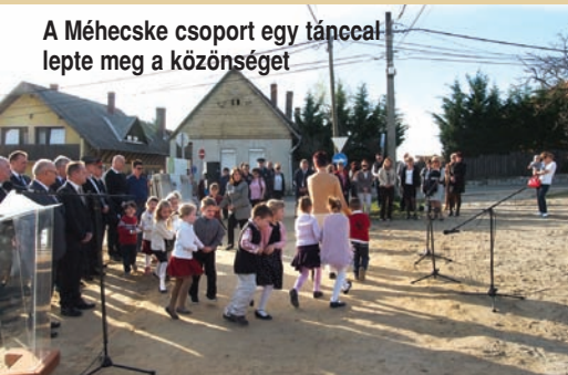
A Méhecske csoport egy táncal- lepte meg a közönséget