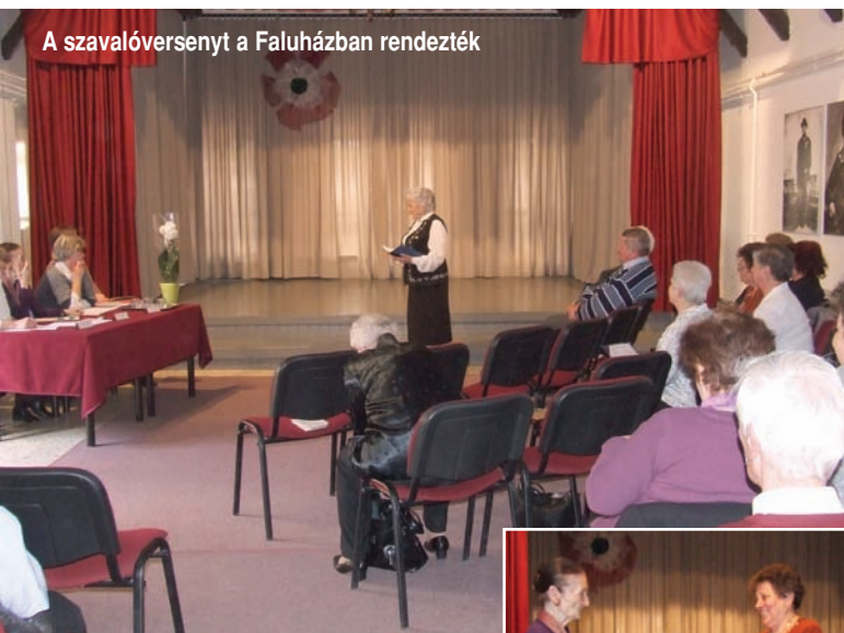
A szavalóversenyt a Faluházban rendezték