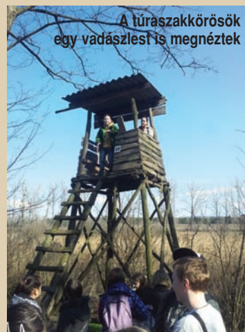
A túraszakkörösök egy vadászlést is megnéztek