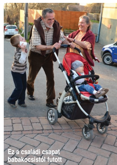
Ez a családi csapat babakocsistól futott