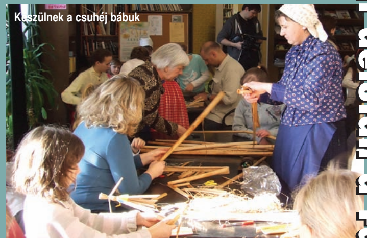
Készülnek a csuhéj bábuk

Jó hangulatú programon vehettek részt március 8-án azok, akik elmentek a Faluház „ Farsangi Hagymányok Háza ” elnevezésű családi délutánjára. A háromkor kezdődött eseményen a gyermekek és a felnőttek egyaránt nagy lelkesedéssel vettek részt a kézműves foglalkozáson, ahol zörgő-csörgő és csuhéj bábút lehetett készíteni, de volt babfejtés és kukorica morzsolás is. A táncházhoz élő muzsika járt, de nem maradt el a farsangi fánk kóstolás sem. A házigazda szerepét a Szadai Népi Együttes vállalta.