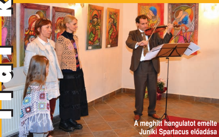
A meghitt hangulatot emelte Juniki Spartacus előadása