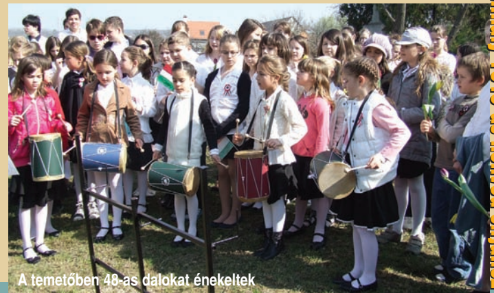
A temetőben 48-as dalokat énekeltek

Jó hangulatú programon vehettek részt március 8-án azok, akik elmentek a Faluház „ Farsangi Hagymányok Háza ” elnevezésű családi délutánjára. A háromkor kezdődött eseményen a gyermekek és a felnőttek egyaránt nagy lelkesedéssel vettek részt a kézműves foglalkozáson, ahol zörgő-csörgő és csuhéj bábút lehetett készíteni, de volt babfejtés és kukorica morzsolás is. A táncházhoz élő muzsika járt, de nem maradt el a farsangi fánk kóstolás sem. A házigazda szerepét a Szadai Népi Együttes vállalta.