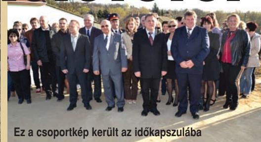
Ez a csoportkép került az időkapszulába