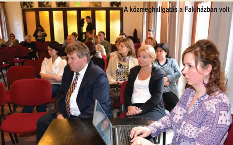
A közmeghallgatás a Faluházban volt

Útprogram első sikeres része a malomvégi úthálózat egy részének fejlesztése volt. Szilárd útburkolatot kapott az Árpád u., az Aradi u., a Mátyás király u., Sport u., az Akácfa u. és a József Attila u., valamint az említett utcákat összekötő kisebb utcák. Összességében másfél km hosszan aszfaltoztak. A VO-LÁN, közvetlen buszjáratot indított a Veresegyház–Szada–Budapest útvonalon. Ezek a járatok 4 hónapja közlekednek mindenki megalégedésre. Egyelőre ideiglenes buszmegállókat alakítottak ki, a Vasút utcánál és az Ipari Park bejáratánál de folyamatban van a végleges buszmegállók elkészítése is. Elkezdődött a temető rekonstrukciója és digitális nyilvántartásának feldolgozása. A bejárat teljes frontonján egy nagyon szép kőkerítést terveznek, aminek a belső része urnafal lesz. A kaput is megújítják.