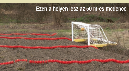
Ezen a helyen lesz az 50 m-es medence

Kiemelt állami beruházás keretében új versenyuszoda épül Gödöllőn. Ezt Balog Zoltán, az Emberi Erőforrások Minisztériumának vezetője, Simicskó István, a szaktárca sportért és ifjúságért felelős államtitkára, valamint Vécsey László országgyűlési képviselő jelentette be a március 6-án, a Szent István Egyetem Ady Endre sétányon található kertészetében megtartott sajtótájékoztatón. Elsőként Balog Zoltán miniszter beszélt a beruházás jelentőségéről. A miniszter szerint a gödöllői, valamint a Budapest északkeleti agglomerációjának igényeit figyelembe véve, indokoltá vált a térségben egy hiánypótló, nemzetközi versenyek megrendezésére is alkalmas fedett versenyuszoda megépítése. A komplexumban egy 50 méteres medencét alakítanak ki, amihez 1.000 fős lelátó kapcsolódik majd. Bemelegítő és tanmedence is létesül, valamint wellness funkciókat kiszolgáló egységeket is kialakítanak. A beruházás megközelítőleg 2,5-3 milliárd forintba fog kerülni, a teljes összeget költségvetési forrásból biztosítják. Az uszodához szükséges terület állami tulajdonban van, kezelője a Szent István Egyetem.