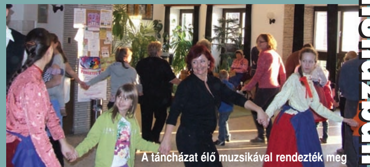
A táncházat élő muzsikával rendezték meg

Tavaszi virágos emlékséte Kollerffy Koller Mihály 1848-as honvéd sírjához Családi délután a Faluházban