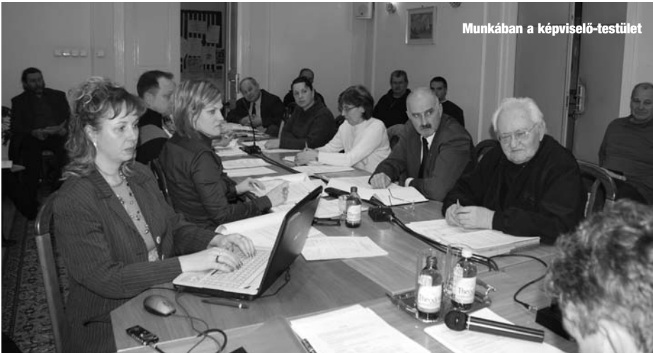
Munkában a képviselő-testület

Ft-ot nyertünk, a község pedig hozzá tesz 45 milliót, mert a teljes beruházási költség 144 millió Ft.