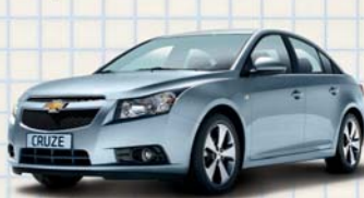
Cruze LS klímával már 3 899 000 Ft-ért

A Chevrolet Katona az idei őszre is osztályelső ajánlatokkal készül Gödöllőn! Akciós modelleinket most is egyszerű áron adjuk, sokoldalú felszereltség mellett. Kezdje a tanévét nálunk, keresse fel gödöllői márkakereskedésünket!