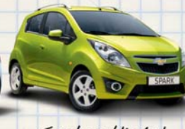
Spark 1.0 klímával már 2 399 000 Ft-ért