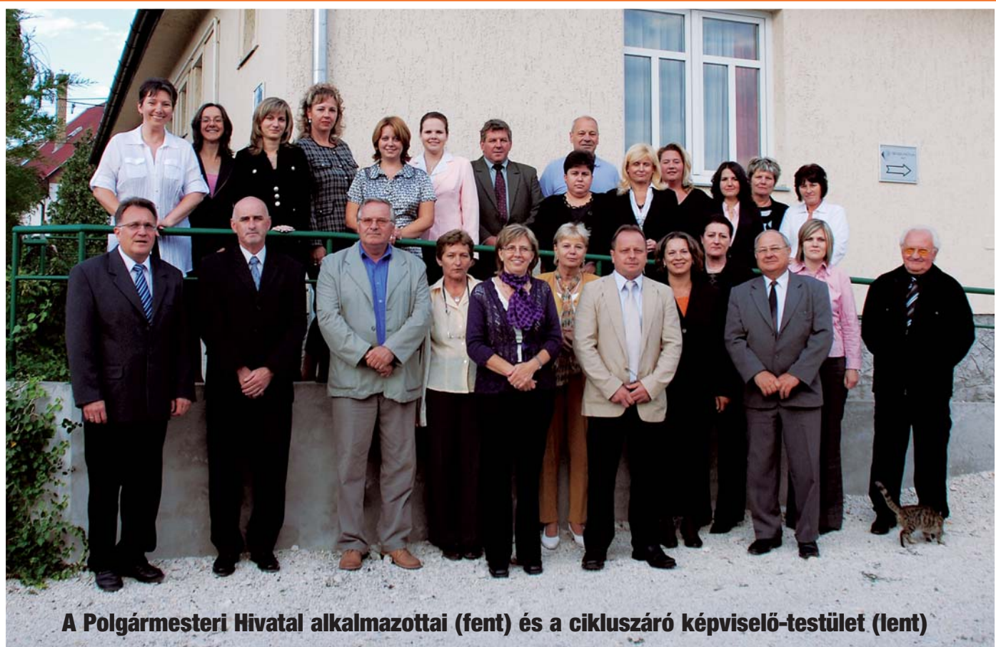
A Polgármesteri Hivatal alkalmazottai (fent) és a cikluszáró képviselő-testület (lent)

A SZADAI ÖNKORMÁNYZAT KÖZÉLETI TÁJÉKOZTATÓ HAVILAPJA VIII. ÉVFOLYAM • 9. SZÁM • 2010. SZEPTEMBER