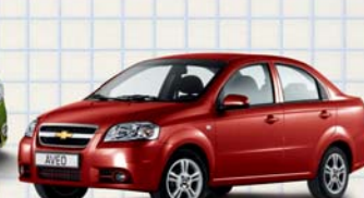
Aveo 4 ajtós 1.2 klímával már 2 499 000 Ft-ért