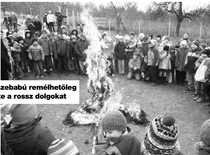
A kislebábú remélhetőleg elvitte a rossz dolgokat

Az emlékévi kosártorna 5. fordulója is lezajlott. Ismét veszítettünk, de reméljük, újult erővel vágnak neki a Maroknyi Székelyek a 6., és egyben utolsó fordulónak április 16-án, amikor mellettük az 5-6. osztályos korosztály, valamint a felnőtt csapatok is megküzdenek egymással.