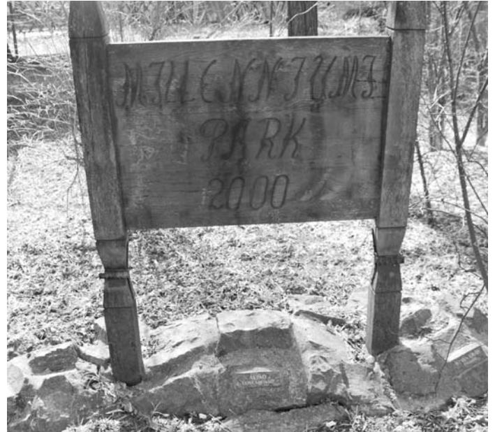
A Mélyárok közelében „előkerült a Millenium Park”