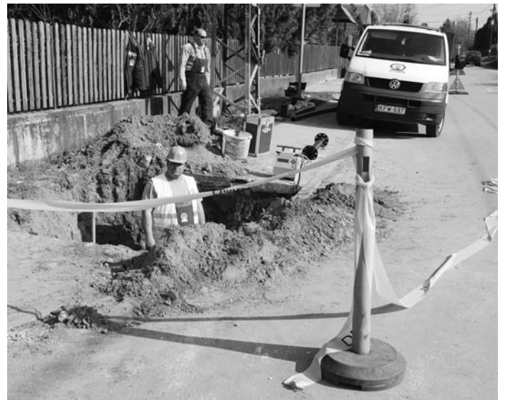
A Vízművek is talált tennivalót a Székely Bertalan út és a Corvin utca sarkán