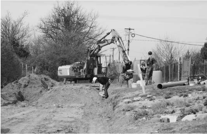
A csatornázás jó ütembe folyik