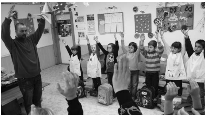
Ha felteszik a kezüket, nagyobbak látja őket a kutya

Az oktatás folyamán elmondásra kerültek – a kiskorúak elleni kutyatámadások és a kutyás balesetek számának csökkentése érdekében – a kutyák testjelei, jelzései, mint pl.: borzolt szőr, félénk, bizonytalan tartás, túl peckes tartás, lecsapott fülek, hátrahúzott fogíny, vicsorgás, morgás a támadásra utaló jelek, de a csóválás, pacsí adás a boldogságra, kedveskedésre utaló jelek. A gyerekek csoportosan gyakorolták, miként kell viselkedni utcán kóbor vagy támadó kutya megjelenésénél egy váratlan helyzetben. Ennek igen nagy jelentősége van, mert a kutyatámadások 98%-a emberi mu-