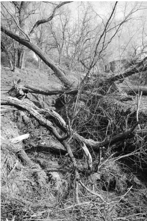
Ilyen állapotok voltak a Mélyárokban