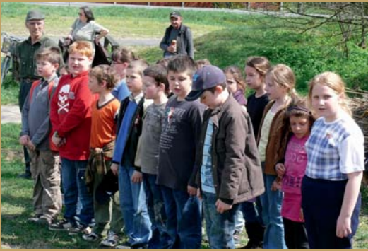
4. osztályosok énekelnek