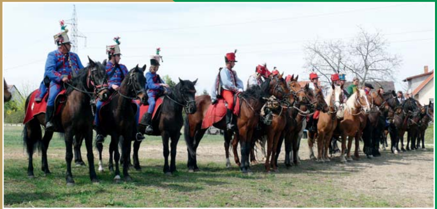
Huszárok a Tavaszi Hadjáraton, Szadán

A huszárok április 7-én érintették Szadát, sajnos a község alig mutat érdeklődést ez után a rendkívül színpompás esemény után, pedig ez végre egy fényes lap a történelmünkben. Mindössze a Lovas Szakosztály és az iskola egy osztálya vett részt a Dobogón lezajlott jeles eseményen.