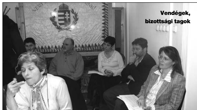
Vendégek, bizottsági tagok