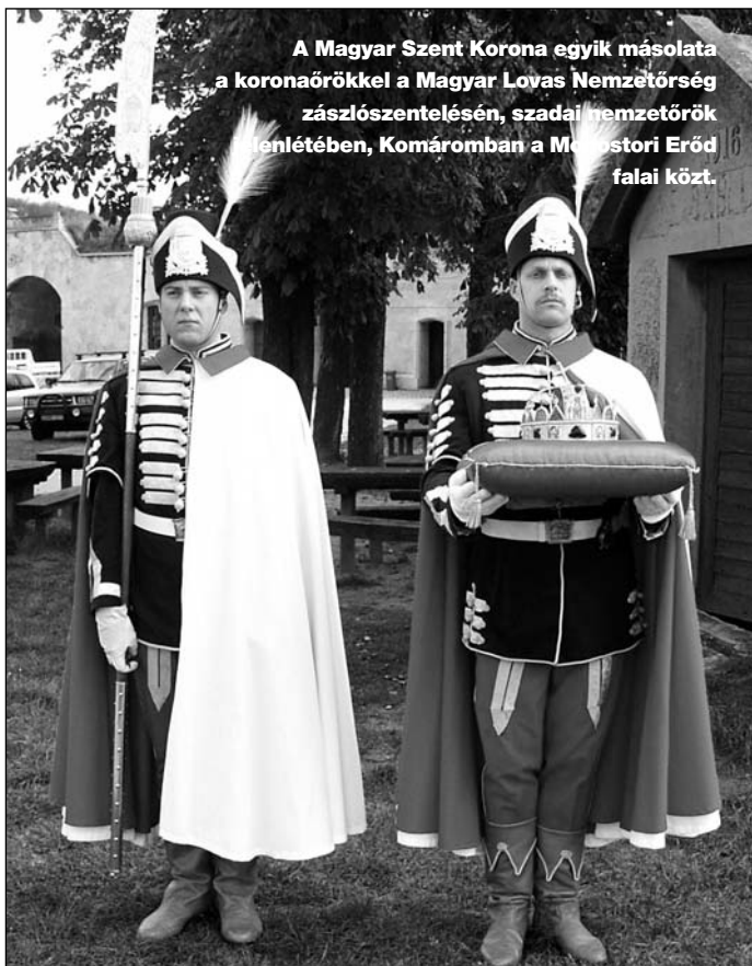
A Magyar Szent Korona egyik másolata a koronaőrökkel a Magyar Lovas Nemzetőrség zászlószentelésén, szadai nemzetőrök létében, Komáromban a Magyar Szent Erőd falai közt.