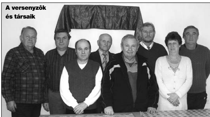
A versenyzők és társaik