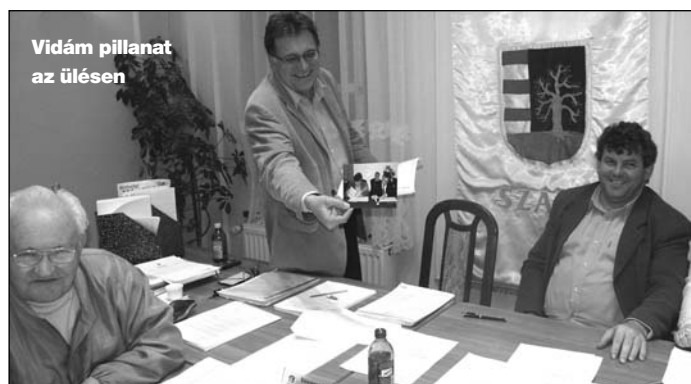
Vidám pillanat az ülésen