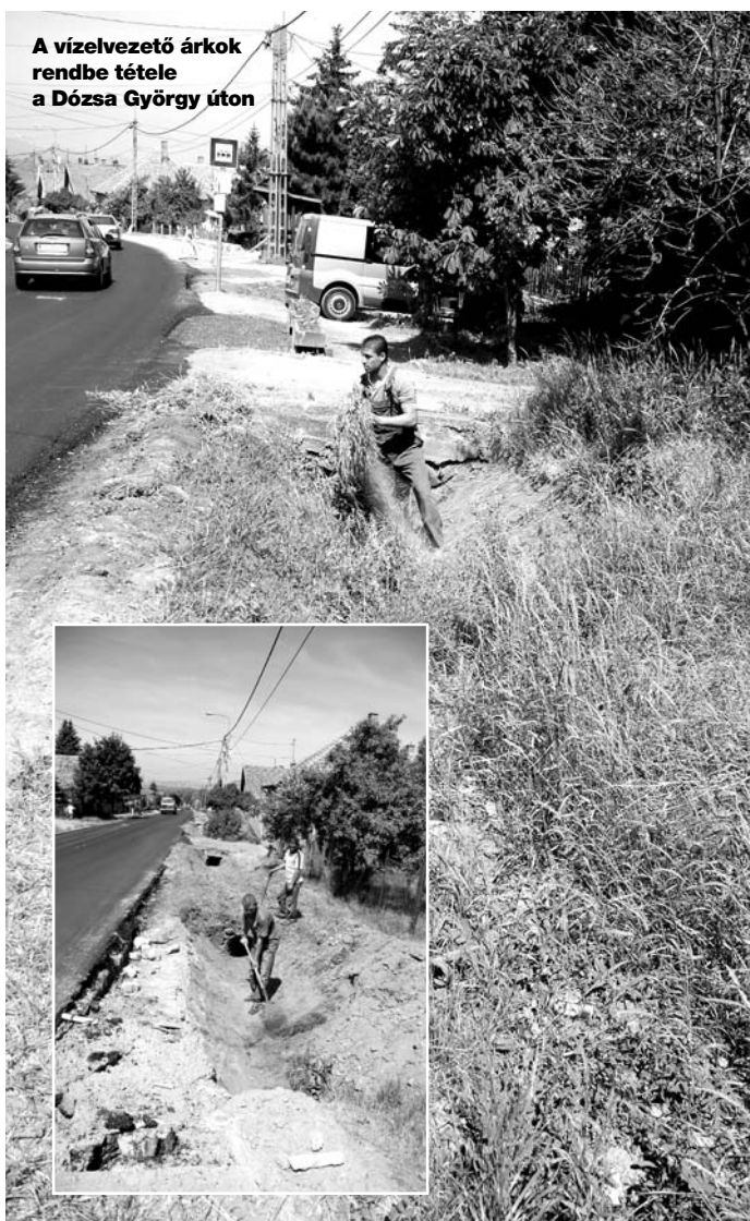
A vízelvezető árkok rendbe tétele a Dózsa György úton