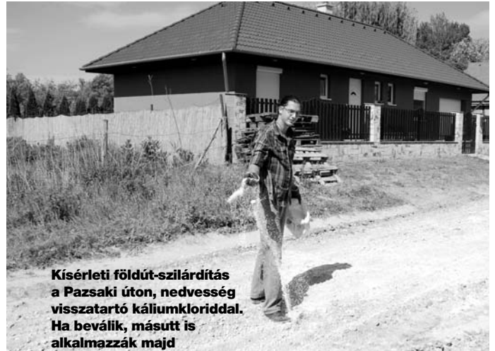
Kísérleti földút-szilárdítás a Pazsaki úton, nedvesség visszatartó káliumkloriddal. Ha beválik, másutt is alkalmazzák majd

A Szentjakabokon folyó földkitermeléshez magasabb jogsza-