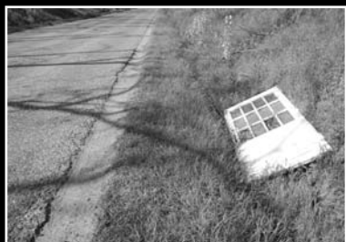
Valaki elveszíthette ezt az ajtót!