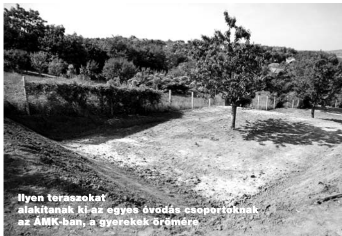
Ilyen teraszokat alakítanak ki az egyes óvodás csoportoknak az ÁMK-ban, a gyerekek öröme