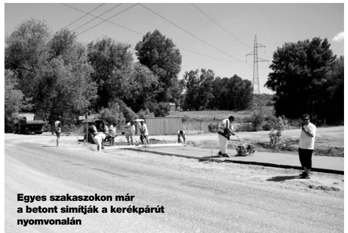
Egyes szakaszokon már a betont simítják a kerékpárút nyomvonalán