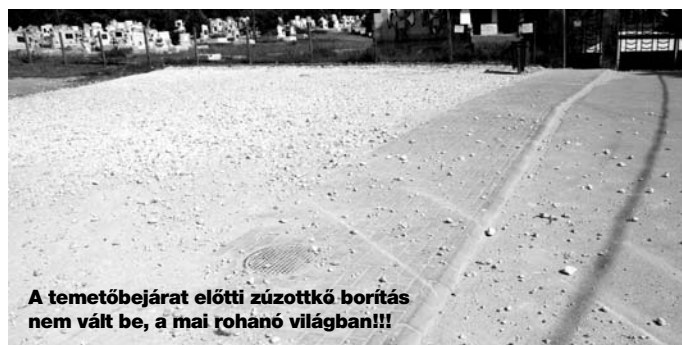
A temetőbejárat előtti zúzottkő borítás nem vált be, a mai rohanó világban!!!

Gyógy- és frissítő MASSZÁZS! Házhoz is megyek! Tel.: 06-20-290-8049