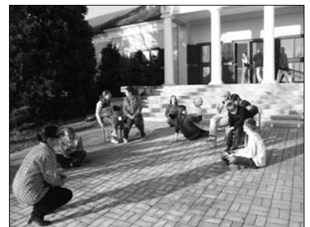
A Színházikó csoport próbát tart, a jó időt kihasználva a Faluház előterében