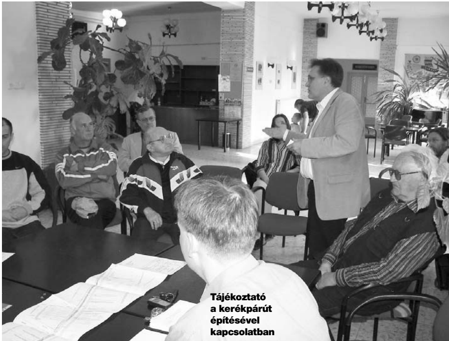
Tájékoztató a kerékpárút építésével kapcsolatban

Április hónapban is tájékoztató fórum előzte meg a képviselő-testületi ülést. Ezúttal a kerékpár-út építésének részleteivel ismerkedhettek az érdeklődők április 6-dikán, 17 órakor, a Faluházban. A kerékpárút építésének ütemezését lásd a keretes részben.