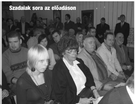
Szadaiak sora az előadáson