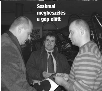
Szakmai megbeszélés a gép előtt