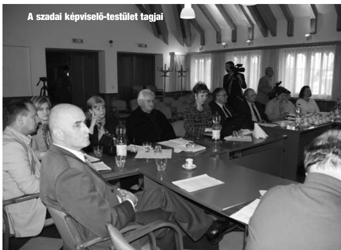
A szadai képviselő-testület tagjai