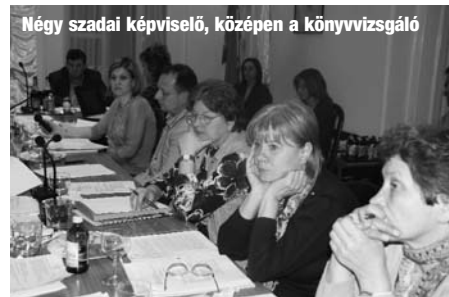
Négy szadai képviselő, középen a könyvvizsgáló

A másik sokakat érintő gond a földutak állapota, melyet zúzottkő borítással tudnak időlegesen rendbe tenni. Ahol viszont a fenti pályázat alapján csatornázni fognak, ott majd a csatorna miatti földmunkák befejezését követően teszik majd rendbe.