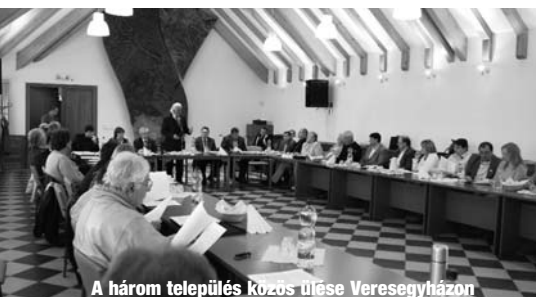
A három település közös ülése Veresegyházon

szát várják, az önkormányzat megfogalmazta igényeit. Polgármester úr felvetette, hogy ha csak a szűken vett feladatokra akarnának egy korszerű egészségházat építeni, akkor azt megépíthetné maga a település is.