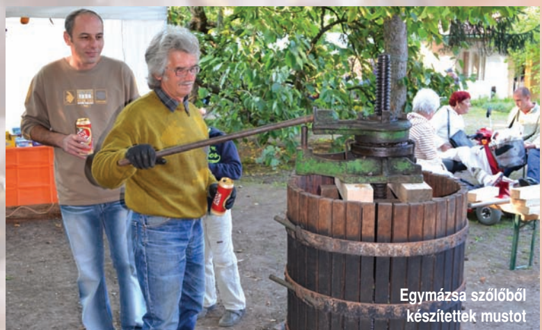
Egymázsa szőlőből készítették mustot