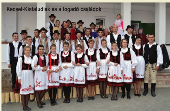
Kecset-Kisfaludiak és a fogadó családok

A Szadai Szüret külön színtoltja volt az erdélyi testvértelepülésről érkezett táncscsoport