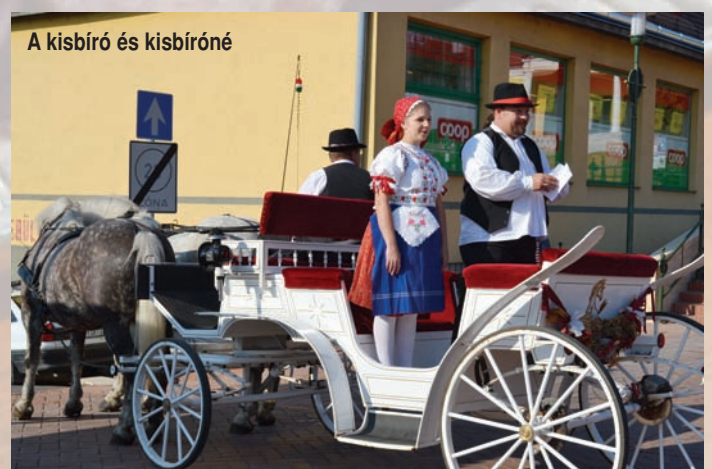
A kisbíró és kisbíróné