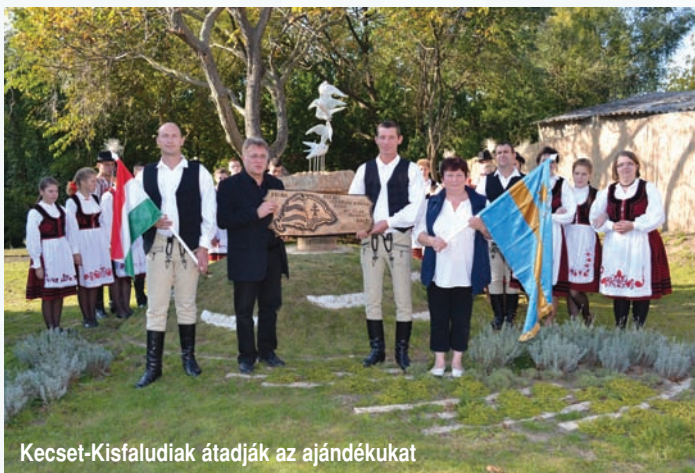
Kecset-Kisfaludiak átadják az ajándékukat