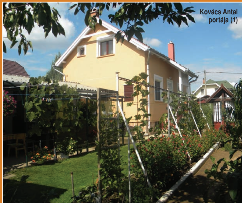
Kovács Antal portája (1)