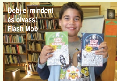
Dobj el mindent és olvas! Flash Mob

A Székely Bertalan Napköziotthonos Óvodának idén kiemelt területe az irodalmi nevelés. Ennek kapcsán szervezett formában október hónapban minden csoport megismerkedik a könyvtárral, ahol meshallgatásban, árnybábozásban is részük lesz.