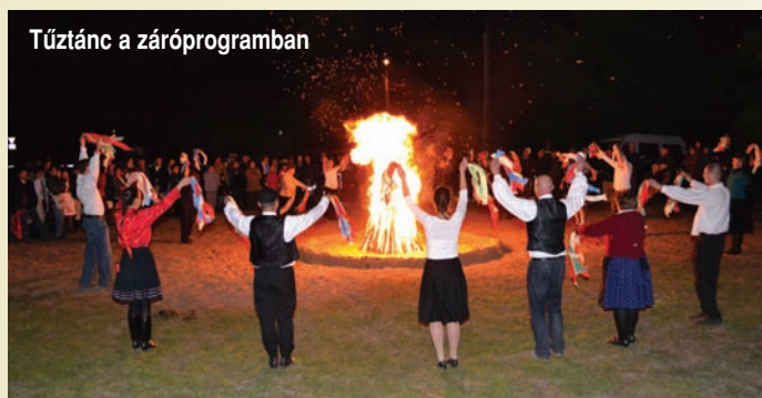
Túztánc a záróprogramban