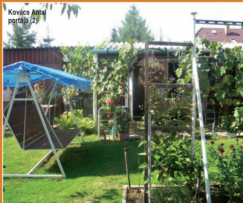
Kovács Antal portája (2)