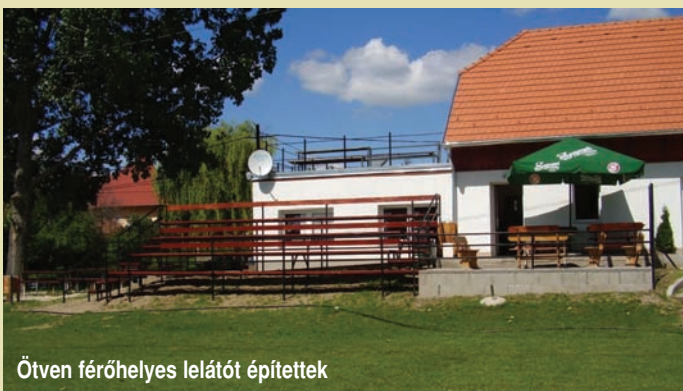
Ötven férőhelyes lelátót építettek

A foci pályán még egy jelentős munkát végeztünk el a nyáron. Egy kútát fúrtunk és részben kiépítettük hozzá az öntözőberendezést. Ezzel jelentősen lecsökkentettük a locsolás költségeit. A pálya körüli gond-