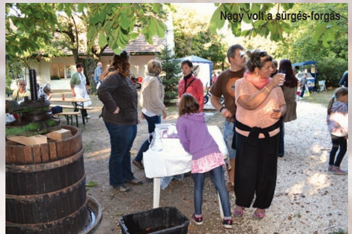
Nagy volt a sürgés-forgás