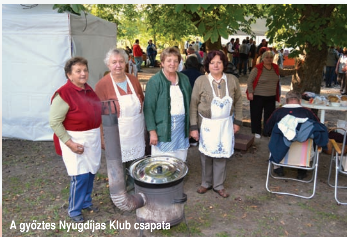
A győztes Nyugdíjas Klub csapata