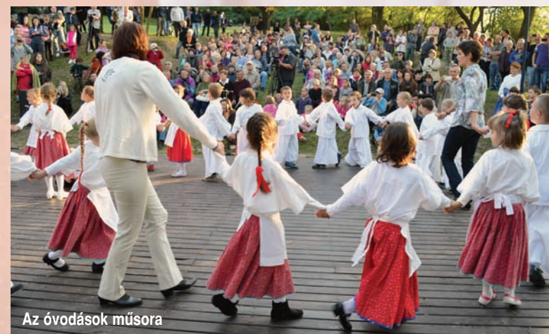
Az óvodások műsora