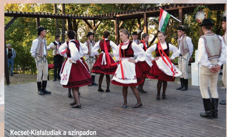
Kecset-Kisfaludiak a színpadon