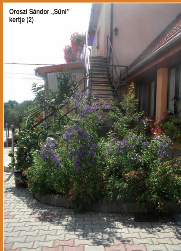
Oroszi Sándor „Süni” kertje (2)