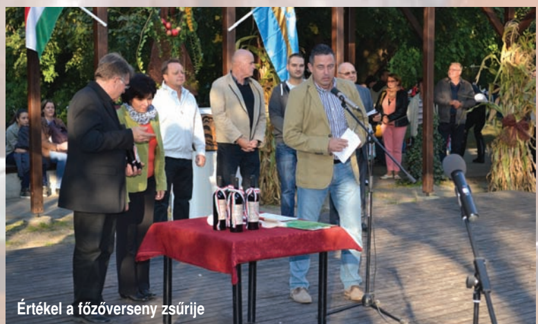
Értékel a főzőverseny zsűrije