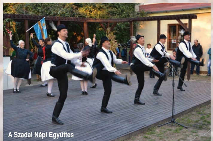
A Szadai Népi Együttes