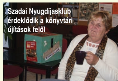
Szadai Nyugdíjasklub érdeklődik a könyvtári újítások felől