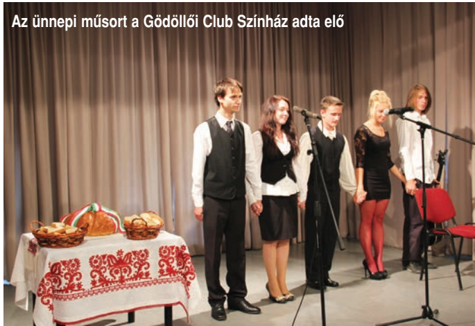
Az ünnepi műsort a Gödöllői Club Színház adta elő