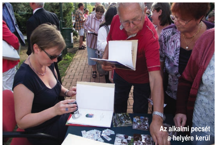
Az alkalmi pecsét a helyére kerül