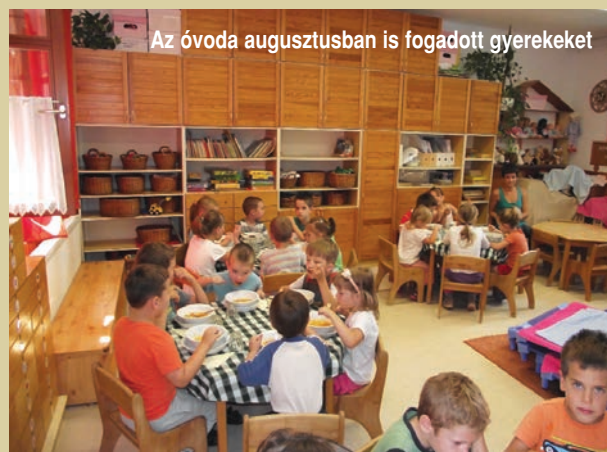
Az óvoda augusztusban is fogadott gyerekeket