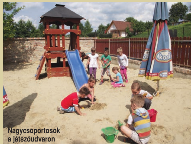
Nagycsoportosok a játszódudvaron