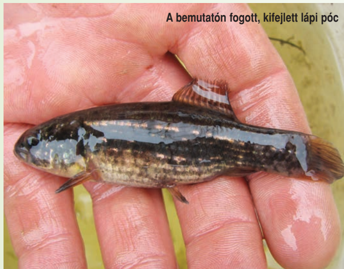
A bemutatón fogott, kifejlett lápi póc

A Tavirózsa Egyesület 2008-ban indította el a Lápi Élőhely-fejlesztési Mintaprogramot, melynek fő célja egy halfaj, a fokozottan védett lápi póc európai állományainak védelme és gyarapítása. A Vidékfejlesztési Minisztérium Zöld Forrás Programjának támogatásával 2013–2014 folyamán újabb jelentős előrelépések történtek a program megvalósításában, melyek dióhéjban a következők: