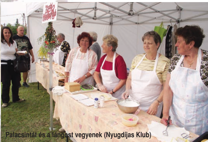
Palacsintát és a lángost vegyenek (Nyugdíjas Klub)