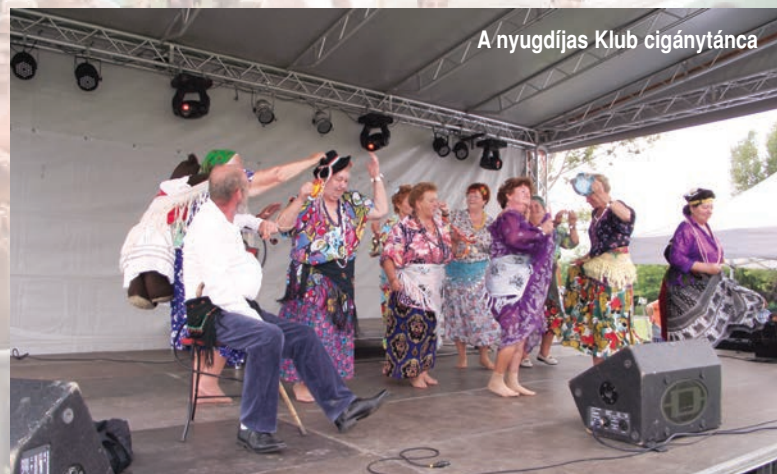
A nyugdíjas Klub cigánytánca

Most is volt ingyenes ugrálóvár, kürtöskalács és édesség a gyerekeknek, sör, bor, virsli a felnőtteknek. A Nyugdíjas Klub tagjai most is szorgalmasan sütötték a palacsintát és a lángost. Délután négy órakor kezdődtek a programok a sportpálya közepén felállított színpadon. Elsőként lépett a közönség elé a két éve Szadán debütált zenekar a Rodeo Jam. A vers-egyházi, főtí, erdőkertesi és szadai fiatal zenészekből álló rock banda szép lassan kilép az amatőrök táborából. Kíváncsian vártuk, hogy milyen táncos produkcióval rukkol elő a Nyugdíjas Klub. A tavalyi hastánc után most cigánytáncsal szórakoztatták a közönséget. A gyerekeknek szóló Pin-