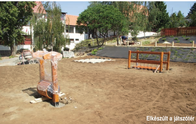
Elkészült a játszótér