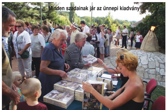
Minden szadainak jár az ünnepi kiadvány