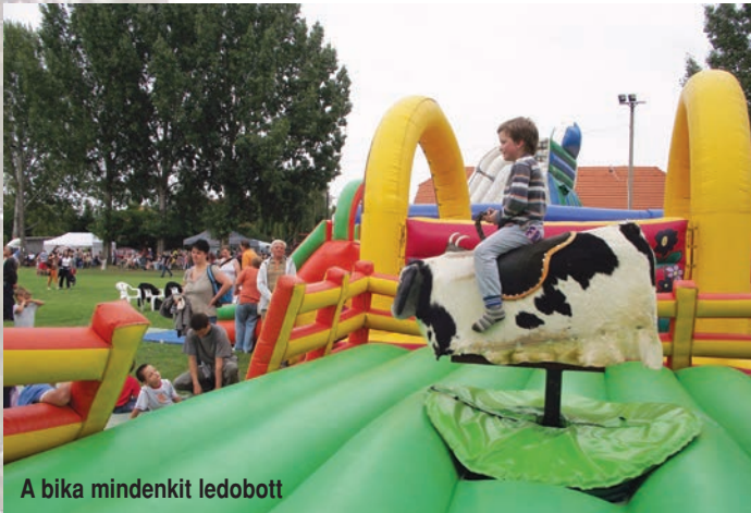
A bika mindenkit ledobott