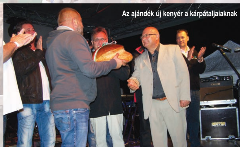
Az ajándék új kenyér a kárpátaljaiaknak