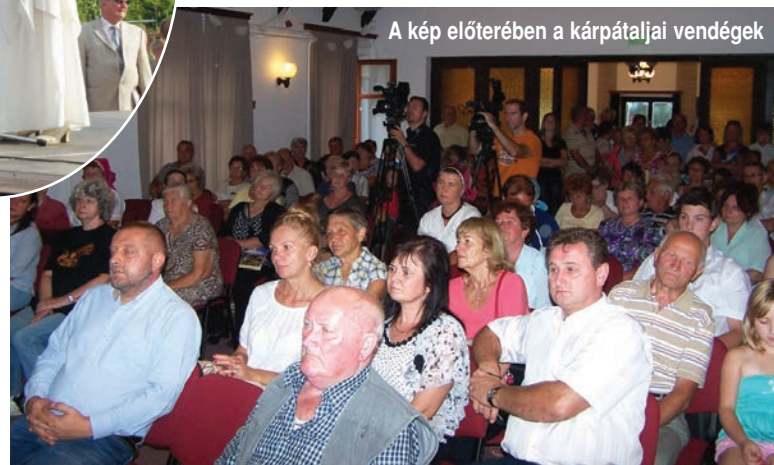
A kép előterében a kárpátaljai vendégek