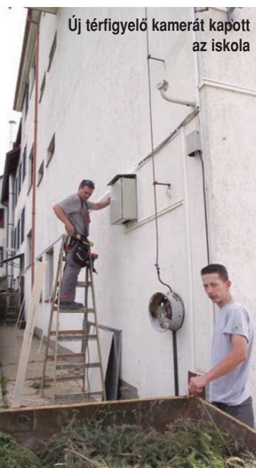
Új térfigyelő kamerát kapott az iskola