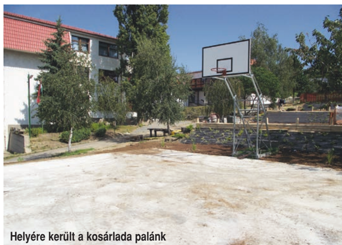
Helyére került a kosárlada palánk