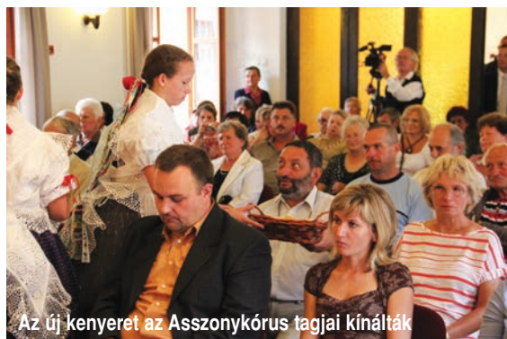
Az új kenyeret az Asszonykórus tagjai kínálták