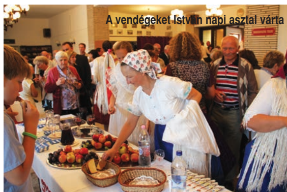
A vendégeket István napi asztal várta