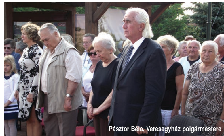
Pásztor Béla, Veresegyház polgármestere