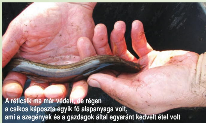
A réticsik ma már védett, de régen a csíkos káposzta egyik fő alapanyaga volt, ami a szegények és a gazdagok által egyaránt kedvelt étel volt