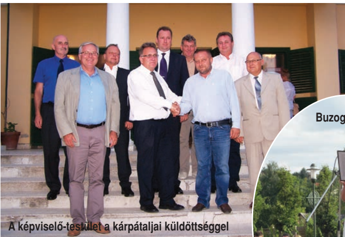
A képviselő-testület a kárpátaljai küldöttséggel