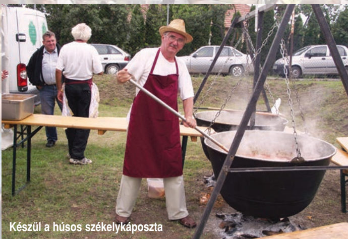
Készül a húsos székelykáposzta