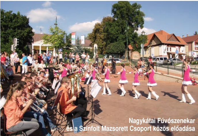
Nagykátai Fúvószenekar és a Színfolt Mazsorett Csoport közös előadása