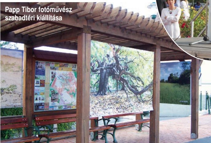
Papp Tibor fotóművész szabadtéri kiállítása