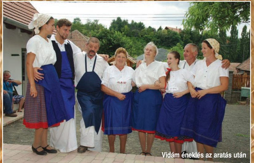
Vidám éneklés az aratás után