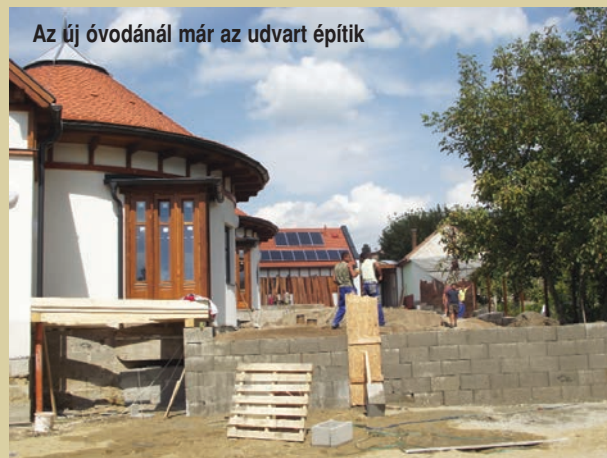
Az új óvodánál már az udvart építik