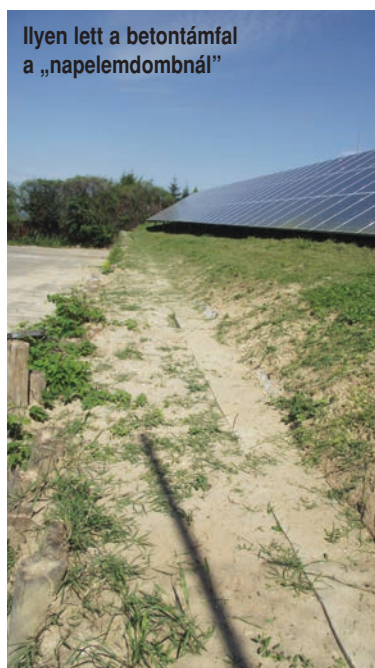
Ilyen lett a betontámfal a „napelemdombnál”