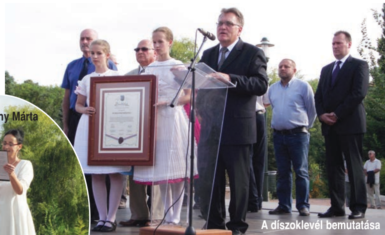
A díszoklevél bemutatása