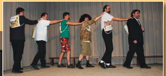
Az iskola jótékonyági bálján a tanárok mulattatták a vendégeket