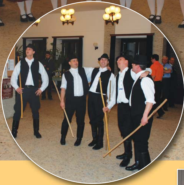
Részlet a Borbál műsorából