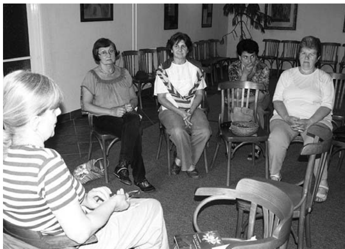
Ismeretterjesztő beszélgetés a virágterápiáról, a Faluházban