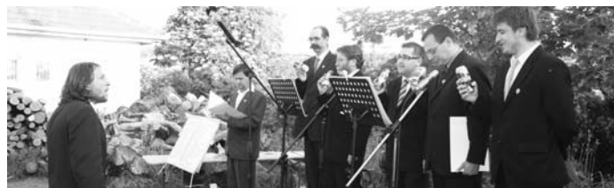
Az iskola férfikara énekel