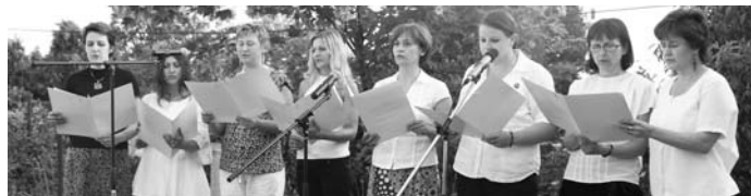
Az iskola női kara