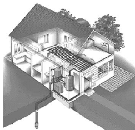
Talajszonda működési vázlatja

A jövő útja a megújuló energia, de erőteljesebb állami szerepvállalás nélkül egyelőre a kutatásnál, a felméréseknél tartunk.