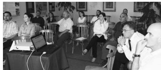
A résztvevők egy csoportja

Maradt azonban más lehetőség, ilyen a szél- és a napenergia hasznosítása, a talaj-