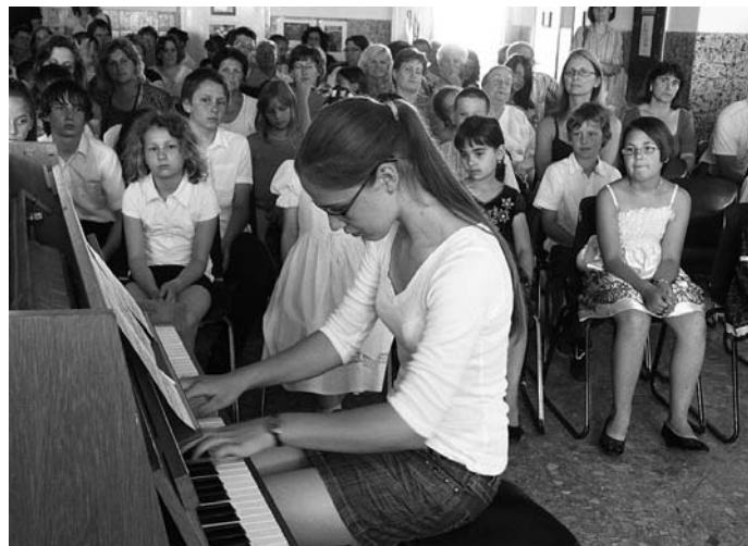
Zongoravizsga az ÁMK-ban

Szeretettel várjuk az érdeklődőket, rossz idő esetén Múteremházi vetítés lesz!