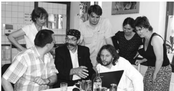
Élmények felidézése a Pedagógus Napon