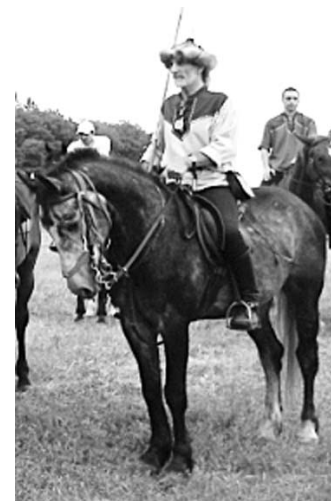
A képek a Tarsolyos Lovasrendezvényen készültek