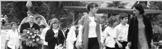
A 4. évfolyam a községi Hősök Napi megemlékezésén