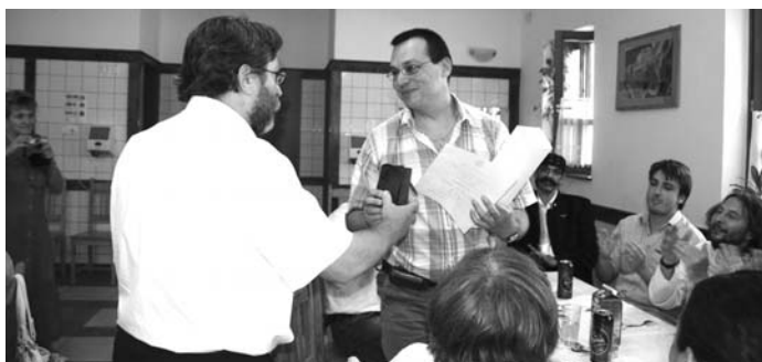
Kollárik tanár úr átveszi az Év Pedagógusa díjat

Megrendeztük a Székely Mozaik műsort , az idén azonban rendhagyó módon: a diákok helyett ezúttal a volt diákok és a