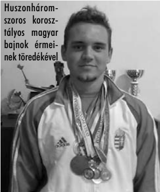
Huszonháromszoros korosztályos magyar bajnok érmeinek töredékével