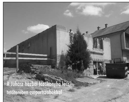
A Juhász házból főzőkonyha lesz, tetőterében csoporszobákkal