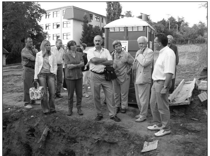
Szemle az iskolaudvaron