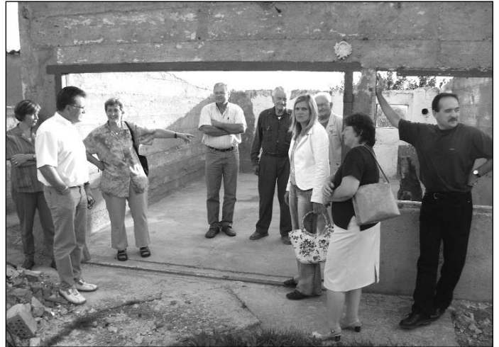
Képviselők a Ványi féle ház garázs előtt

Az iskola tájékoztatása szerint egyre kevesebb gyermek veszi igénybe ezt a lehetőséget, a tanév végén már csak 70 tanuló fogyasztotta a dobozos tejet. Részben pénzügyi okokból – a beígért állami hozzájárulás fél év múltán sem érkezett meg – is úgy döntött a képviselő-testület, hogy átmenetileg szüneteltetik a tejesztást, amíg arra ismét nem érkezik jelentős igény.