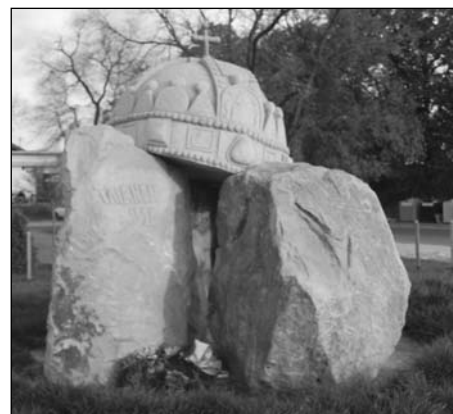
Ez a Dunakeszin található emlékmű azt mutatja, hogy a Trianon miatt széttöredezett országot a Korona mégis egybetartja.