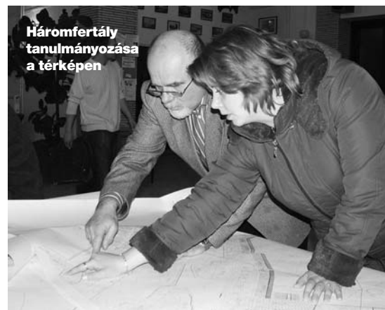
Háromfertály tanulmányozása a térképen