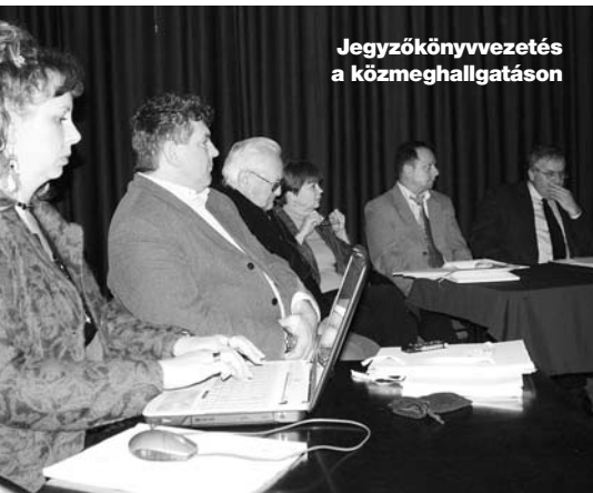
Jegyzőkönyvvezetés a közmeghallgatáson