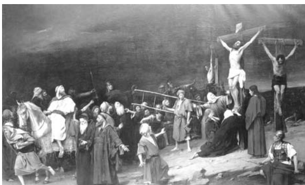
Munkácsy Mihály Golgota