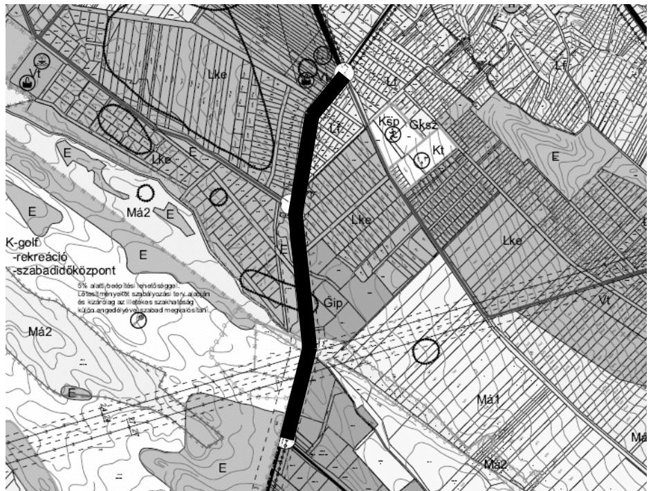
A szadai új kerékpárút tervezett nyomvonala (vastag feketével kiemelve)

Örömmel tájékoztatjuk Szada lakosságát, hogy a Mogyoródra vezető országos közút bal oldalán, a Vasút utca és az Ipari Park között tervezett kerékpárút építése rövidesen megkezdődik. Az Önkormányzat még 2007. november-decemberben sikeres pályázatot nyújtott be az Új Magyarország Nemzeti Fejlesztési Terv részeként megvalósuló Közép-Magyarországi Régió Operatív Program keretében, s összesen csaknem 60 millió forint vissza nem térítendő támogatáshoz jutott (a projekt azonosítószáma: KMOP-2.1.2-2007-0020).