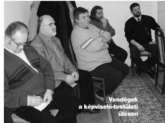
Vendégek a képviselő-testületi ülésen

A közterület-felügyelői tevékenységet eredményesnek ítélte a képviselő-testület és kifejezték reményüket, hogy a várhatóan ide települő körzeti megbízott rendőrrel kiegészülve Szada közbiztonsága erősödhet.