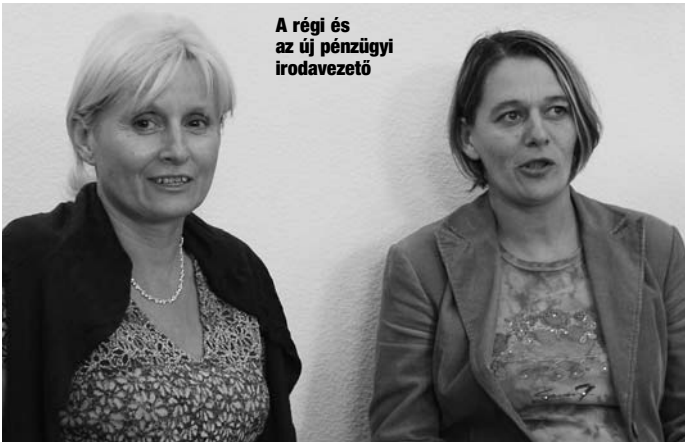
A régi és az új pénzügyi irodavezető

a területhez a volt anyagbánya és a Hévíz kutak környéke, mely utóbbi fúrása már jó ideje szünetel, befektető hiányában. Biztató azonban, hogy a Tesco, mint nagy energia-felvevő, igényt tart a hévíz adta olcsó lehetőségre. Ez a tény újabb pályázati lehetőségeket nyithat, amellyel együtt már vonzóvá válhat a hévíz-beruházás egy nagytőkés csoport számára.