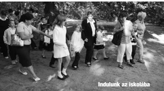
Indulunk az iskolába

Tisztelettel köszöntök minden jelenlévőt, régi és új diákokat, szülőket, pedagógus kollégákat, ÁMK dolgozókat, megjelent vendégeinket, Vécsey László polgármester urat, jegyző urat, képviselő hölgyeket és urakat, Sipos Bulcsu Kadocsa esperes urat, valamint a Történelmi Vitézi Rend megjelent tagjait.