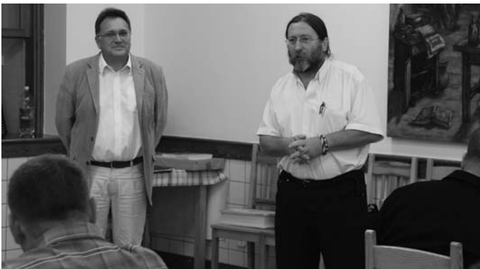
Az új termek szemléje és fogadás az önzetlen építők tiszteletére

igazgató úr felsorolásából az derült ki, hogy az önzetlenül dolgozó emberek közt többségben voltak, akiknek nem is jár ide gyermekük, s ráadásul sokan még csak nem is szadai illetőségűek. Ez az igazi jószándékú önzetlenség, amikor valaki a viszonzás minden elképzelhető lehetősége nélkül vállal áldozatot, mások segítése érdekében. Ezt a nagyszerű hozzáállást, a napjainkban pártját ritkító önzetlenséget emelte ki köszöntő beszédében igazgató úr és Vécsey László polgármester egyaránt. A kialakított termek minősége kifogástalannak bizonyult, a gyerekek és a tanárok használatba is vették azokat.