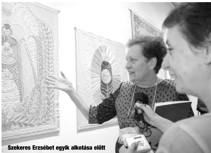
Szekeres Erzsébet egyik alkotása előtt

Persze az is a közösség része, hogy a nagy bográcsban közösen főznek ilyenkor, amit aztán mindenki szívesen fogyaszt