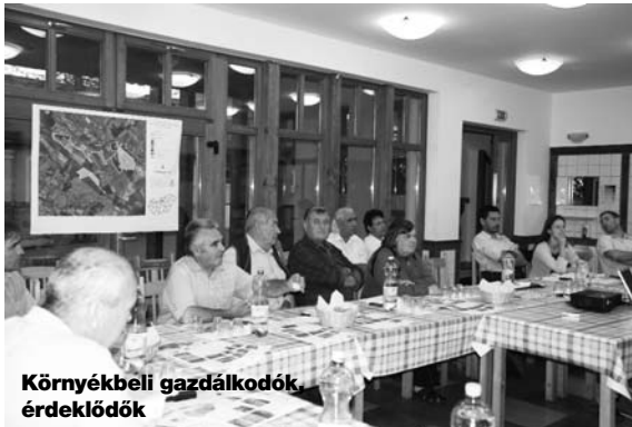
Környékbeli gazdálkodók, érdeklődők

O któber 7-dikén tartottak tanácskozást Szadán a Veregyházi-medence érintett településeinek lakói és gazdálkodói meghívásával a Natura 2000 természetvédelmi kezdeményezés szakértői. Szadán kívül a tervek Mogyoródot és Veregyházát is érintik.