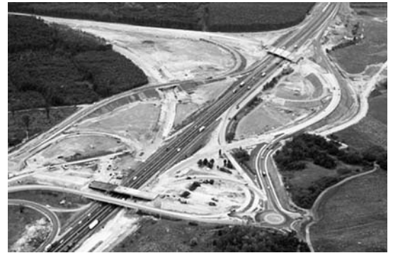
Légifelvétel a csomóponttól.