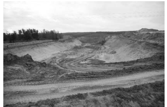
Ezt a hatalmas teknőt a 3-as út mellett ásták a Gödöllő előtti körforgalom mellett. A méreteket mutatja, hogy a jobb hátsó sarokban alig látható kicsi pontok markolót, platós teherautót és munkásokat jelentenek.