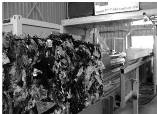
Bálákba préselik a szétválogatott hulladékot

A parkosított, esztétikailag is megnyerő hulladékkezelő központot működtető gazdasági