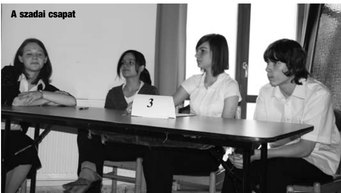
A szadai csapat

Hagyományainkhoz híven az idén is meghirdettük az iskolánk névadójának tiszteletére szervezett vetélkedőt a tágabb környék iskolái számára.