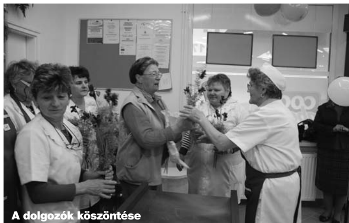
A dolgozók köszöntése

Örülünk neki, mert közel van a bolt, nem kell utazni egy vásárlás miatt. Egy hétig volt zárva, nagyon hiányzott. Ez idő alatt Gödöllőn vettem meg azt, amire nagyon nagy szükség volt és vártuk az újbóli megnyitást. Nagyon szép bolt lett belőle.