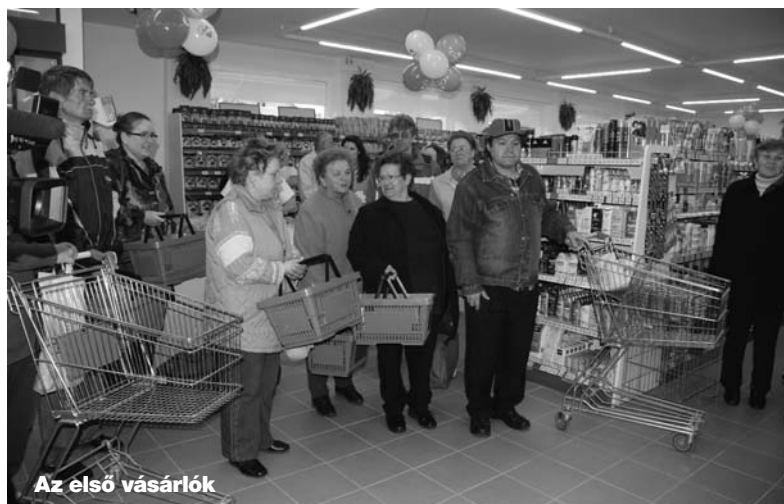
Az első vásárlók