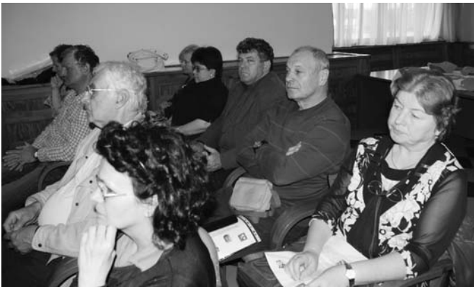
A szadai Polgármesteri Hivatal érintett alkalmazottjai

Ft elszámolható költségből valósulhat meg, 81,87 %-os támogatással, így a 3.262 m Ft vissza nem térítendő támogatáshoz 722,6 m Ft önerőre lesz szüksége a Társulásnak, mivel a következő forduló kedvezményezettjei már nem külön-külön az önkormányzatok.