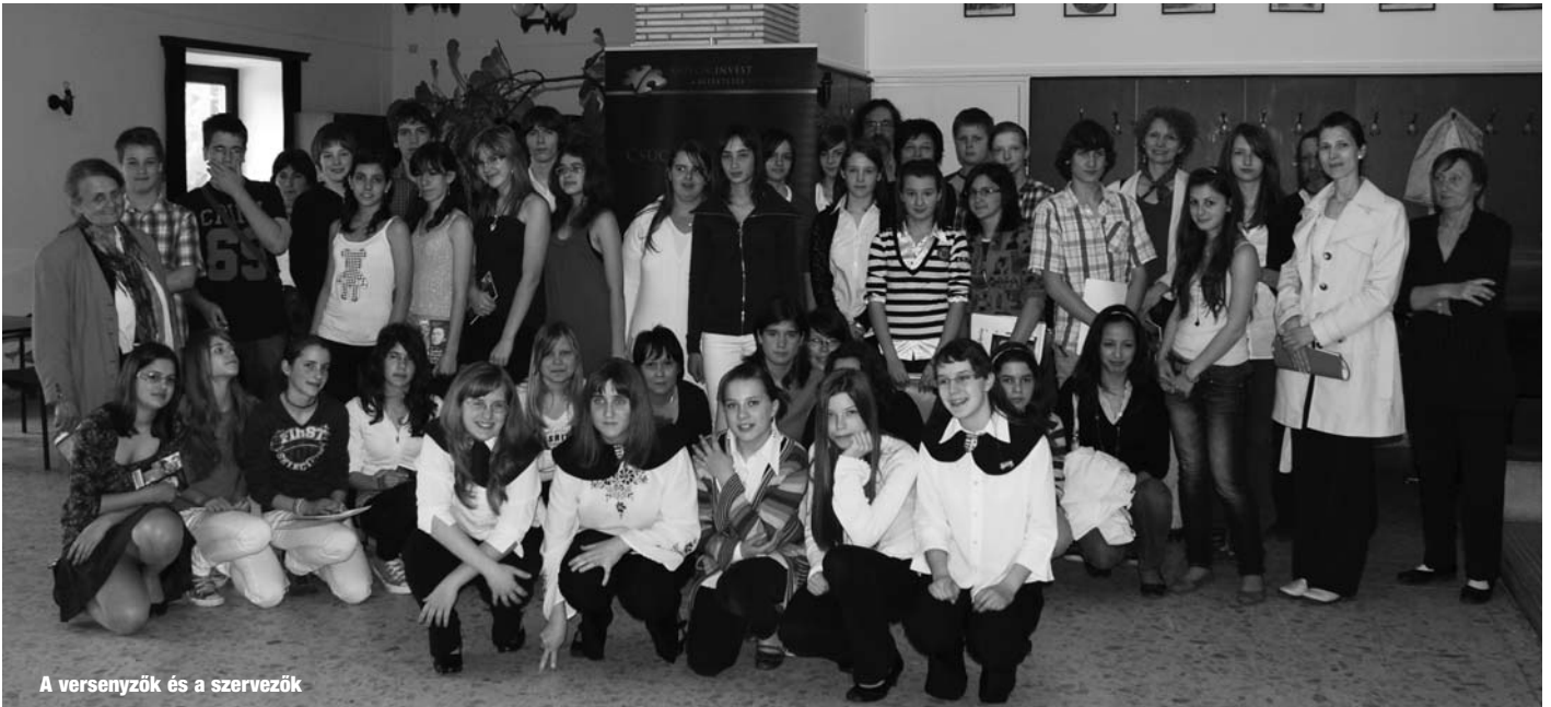
A versenyzők és a szervezők