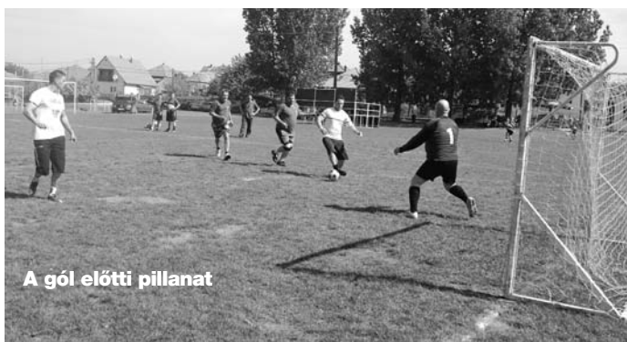
A gól előtti pillanat