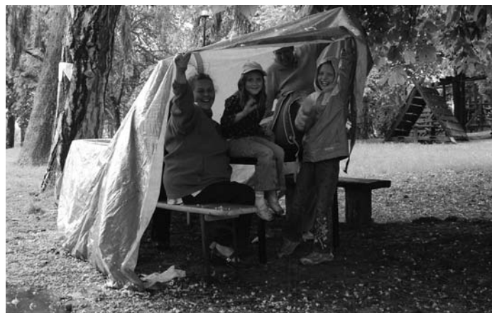
Néhány perccel később