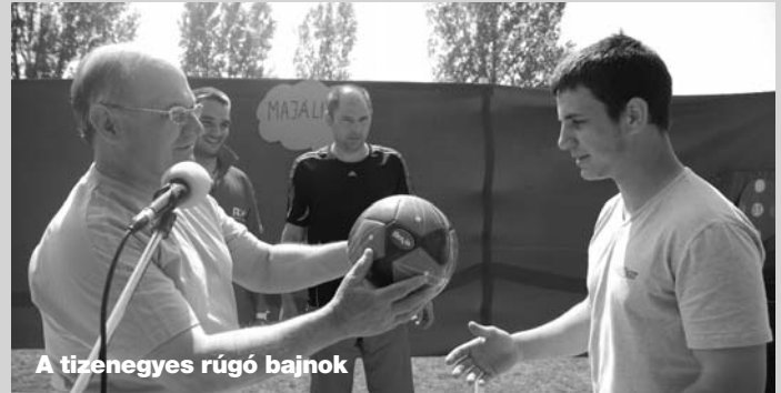
A tizenegyes rúgó bajnok