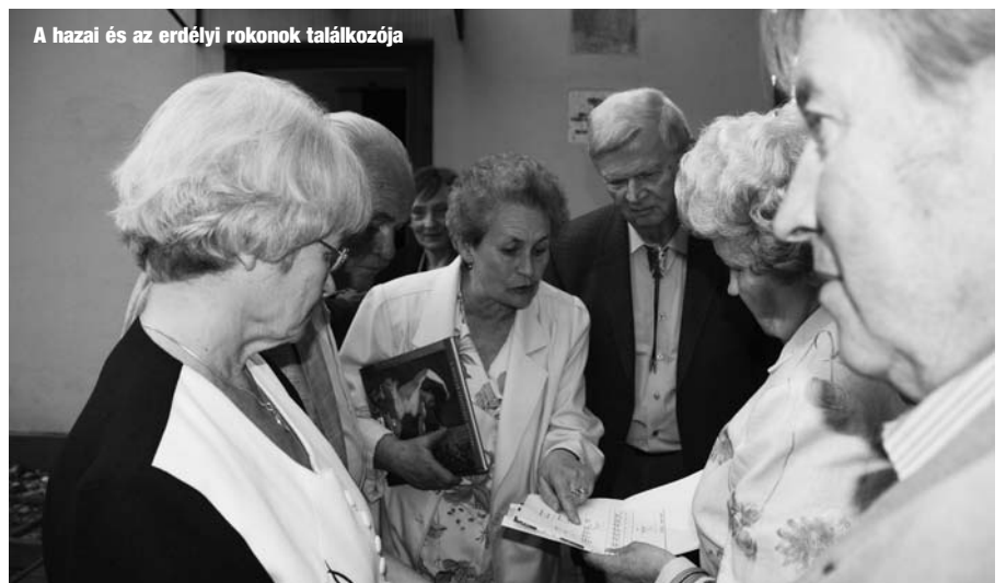
A hazai és az erdélyi rokonok találkozója