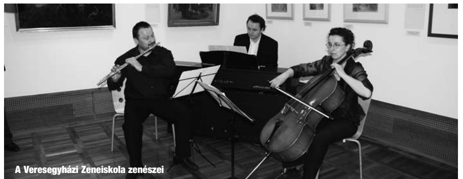
A Veresegyházi Zeneiskola zenészei