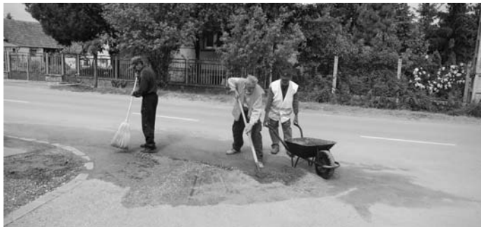
Közmunkások dolgoznak a felhőszakadás során a Székely Bertalan útra kihordott föld eltávolításán

Ennek közterhei alól kibújni pedig lakóházaink megbecsülésének hiányát jelenti.