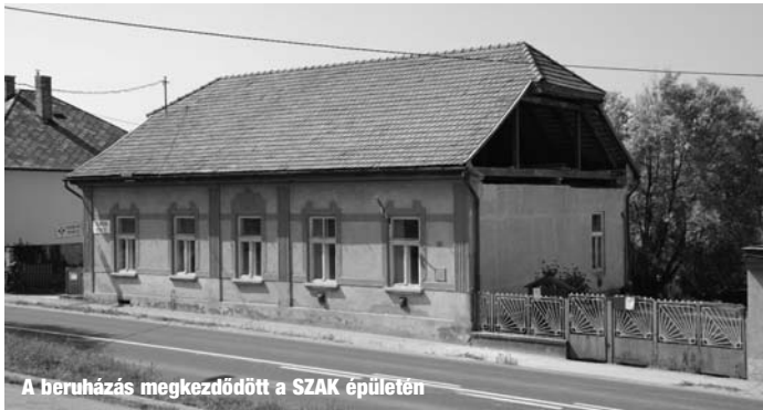
A beruházás megkezdődött a SZAK épületén

A Magyar Élelmiszerbank Szervezet jóvoltából ismét, 2010. június hónap végén, mintegy 320 fő részesülhet tartós élelmiszeradományban. A szervezettől élelmiszert pályázat útján lehet igényelni. Pályázatot csak Önkormányzat vagy segítő szervezet nyújthat be, magán-személy nem. Jelen esetben is az élelmiszeradománnyal kapcsolatos mindennemű feladatot a korábbiakhoz hasonlóan a szadai Családsegítő Szolgálat vállalta fel.