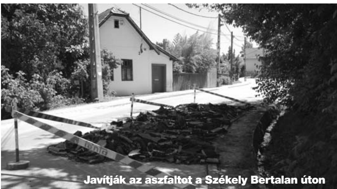
Javítják az aszfaltot a Székely Bertalan úton