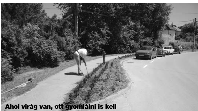
Ahol virág van, ott gyomlálni is kell