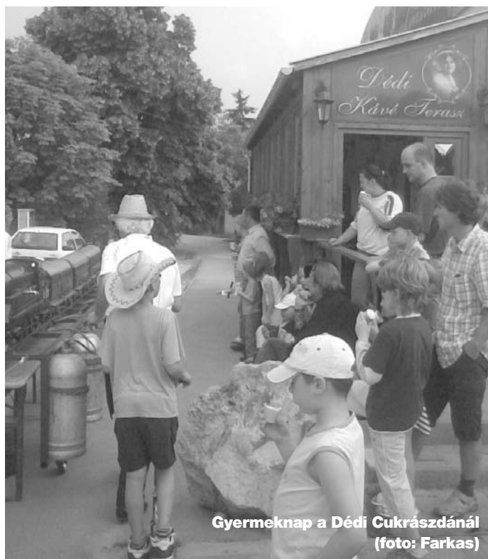
Gyermeknap a Déli Cukrászdánál

A FALUHÁZ JÚLIUS 5-TŐL AUGUSZTUS 5-IG NYÁRI SZÜNETET TART