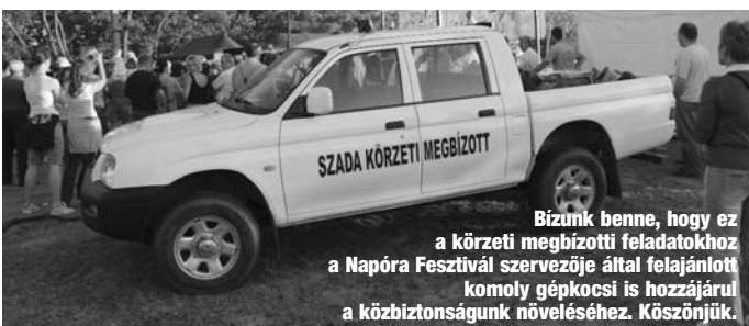
Bizunk benne, hogy ez a körzeti megbizotti feladatokhoz a Napóra Fesztivál szervezője által felajánlott komoly gépkocsi is hozzájárul a közbiztonságunk növeléséhez. Köszönjük.