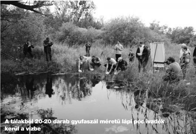
A tálakból 20-20 darab gyufaszál méretű lápi póc ivadék kerül a vízbe

Szada határában telepítettek fokozottan védett, egyenként 100.000 Ft eszmei értékű lápi póc halivadékot veresi szervezetek a SZIE segítségével. A tavaly kezdődött halfaj mentés újabb eseményéről ezúttal a Népszabadság cikkét közöljük.