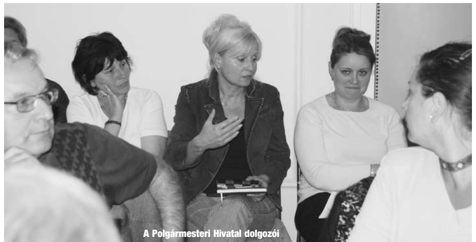
A Polgármesteri Hivatal dolgozói

A régóta folyó egyezkedést a bizonytalanra vált gazdasági helyzet megakasz-