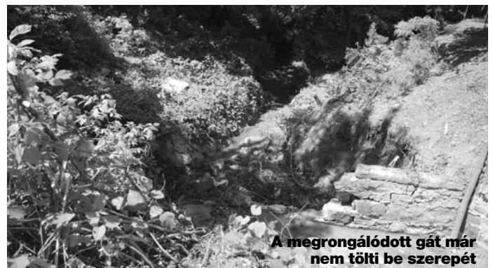
A megrongálódott gát már nem tölti be szerepét