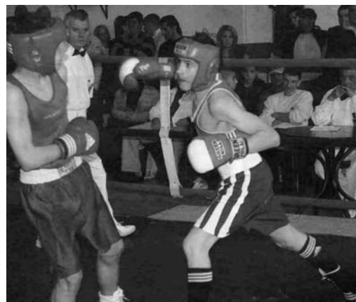
A 2010-es Budapest Bajnokságon, szemben