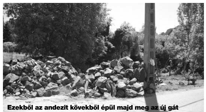
Ezekből az andezit kövekből épül majd meg az új gát