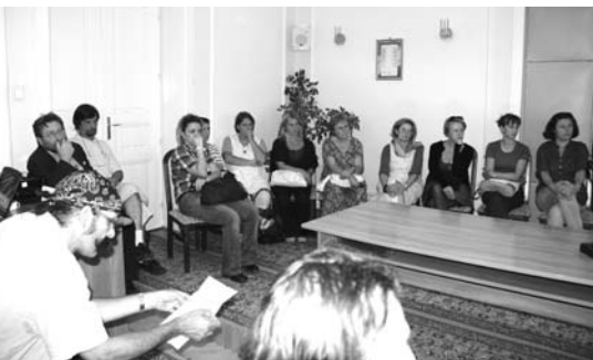
Az iskola pedagógusai a polgármesternél