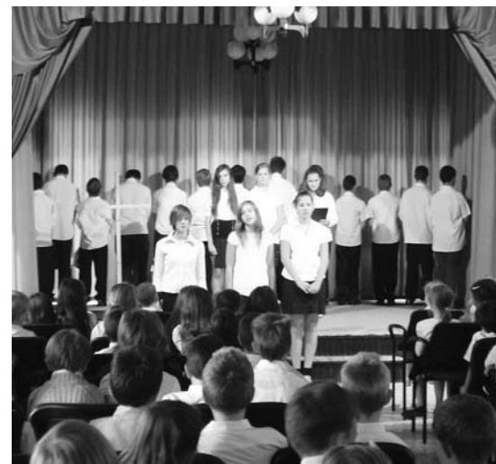
Műsor az aradi 13 tiszteletére

Véget ért az őszi papírgyűjtési akció. Újfént majdnem 2 hétig minden nap hozták a szülők és a gyerekek szorgalmasan a papírt, így október első napjaiban már a harmadik konténert is meg kellett kezdeni. Köszönjük mindenkinek, aki segített a gyűjtésben, hiszen a befolyt pénzüsszeget arányosan az osztályok fogják megkapni.