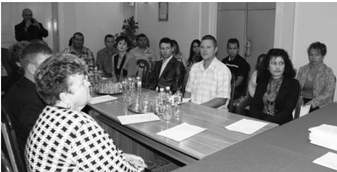
A magyar állampolgárságot folyamodók megtöltötték a tanácstermet

Mindig felemelő érzés jelen lenni egy honosítási szertartáson, amikor egy magyar ember magyar állampolgárságot folyamodik, leküzdi a nehézségeket, s végre valamelyik polgármester előtt esküt tehet. Magyarország ebben is különleges, hogy minden oldalon önmagával határos. A határon túli magyarok a legtöbb esetben nem érzik jól magukat az idegenné vált környezetben, sokszor szembesülnek ellenséges magatartással amiért megvallják magyarságukat, magyar anyanyelvüket használják. Érthető, hogy saját honfitársai közé kíváncsoznak, még ha ez azzal jár is, hogy el kell hagyniuk szülőföldjüket, ősei lakhelyét.