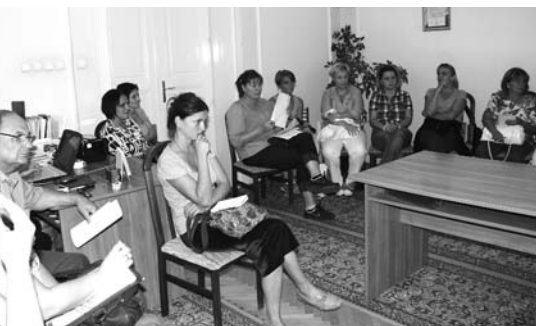
Az SZMK megbeszélés a Polgármesteri Hivatalban