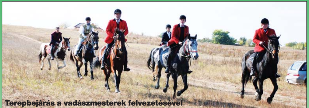
Terepbejárás a vadász-mesterek felvezetésével