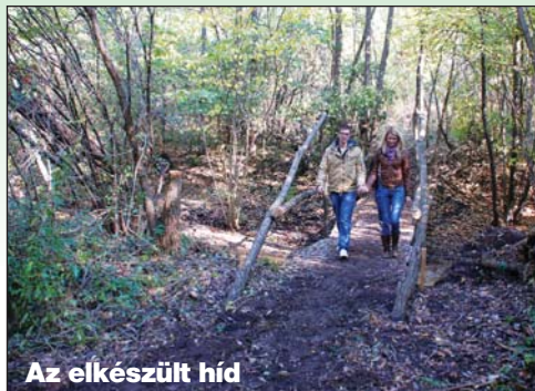
Az elkészült híd