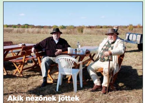
Akik nézőnek jöttek