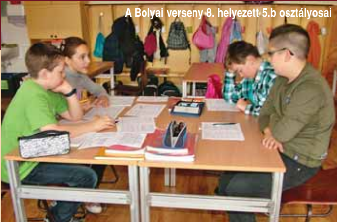
A Bolyai verseny 8. helyezett 5.b osztályosai