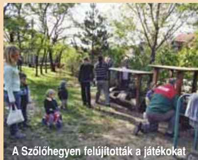
A Szőlőhegyen felújították a játékokat