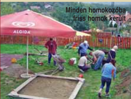
Minden homokozóba friss homok került

Szeptember 29-én szombaton társadalmi munka keretében szépültek az óvodai csoportok udvarai, az időjárás is kedvezett nekünk, a borongós időt, később verőfényes napsütés váltotta fel. Mindegyik csoportból jöttek szülők, akik az óvónőkkel és a dadusokkal együtt lelkesen vettek részt a munkálatainkban. A feladatok között volt faültetés, fűnyírás, száraz ágak levágása, napernyők kivétele, elhelyezése, sövénynyírás, gyomlálás és egyéb apróbb teendő. Az apukák hősiességgel helytálltak a homokhordásban, minden homokozó színültig megtelt friss homokkal. A munkálatok végeztével, teával és zsíros kenyérral vendégeltek meg minket a konyhas nénik. Szeretnénk minden kedves, lelkes résztvevő szülőnek köszönetet mondani a segítségért, és reméljük, hogy jövőre is szívesen eljönnek.