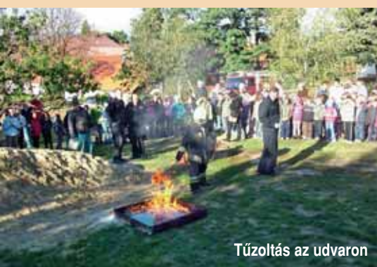
Tűzoltás az udvaron

Végül pedig arról, hogy milyen programok állnak előttünk: a TITOK Arany János Magyar Nyelvi Verseny, az október 23-ai megemlékezés – ne feledjük, hogy október 27. és november 10. szombat ugyan, de munkanap lesz –, és tovább folytatódik a természetverseny és jön a szünet is. Kultúrában sem lesz hiány: a Thália bérletek mennek színházba, a Faluházban pedig hamarosan megnézhetjük a Róka Rudi, valamint A Pál utcai fiúk című előadásokat is. Mindenkinek kellemes őszi időszakot kívánok!