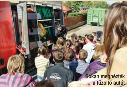
Sokan megnézték a tűzoltó autót

A tavaszi hagyományokat folytatva iskolánk szépen szerepel a szelektív hulladékgyűjtés területén. Eddig 5550 PET palack gyűlt össze. Köszönjük az eddigi gyűjtést a gyerekeknek és a szülőknek, tartsák meg továbbra is e jó szokásukat! Az Italos Karton Környezetvédelmi Egyesülés Iskolai és Óvodai Italos Karton Dobozgyűjtő Programjában, melyet a Zöld Híd szervez, szintén részt veszünk. Kérjük tehát, hogy aki teheti, a háztartásokban feleslegessé vált italos dobozokat kiöblítve és a PET palackokat hozza be az iskolába.