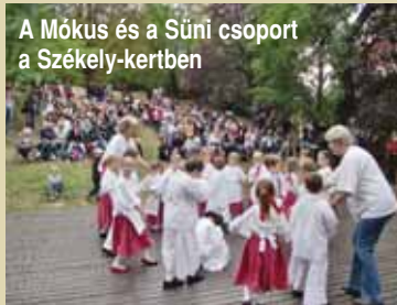
A Mókus és a Süni csoport a Székely-kertben