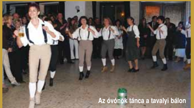
Az óvónők tánc a tavalyi bálon

Belépő: 3000 Ft, vacsorával együtt. Zenét a Hangulat együttes biztosítja. Aki a bálon nem tud részt venni, annak módjában áll pártoló jegyet vásárolni. A pártoló jegy ára: 1500-1000-500 forint. Jegyek kaphatók az óvodában. Mindenkinek jó szórakozást kívánnak: Az óvoda dolgozói és a szülői munkaközösség