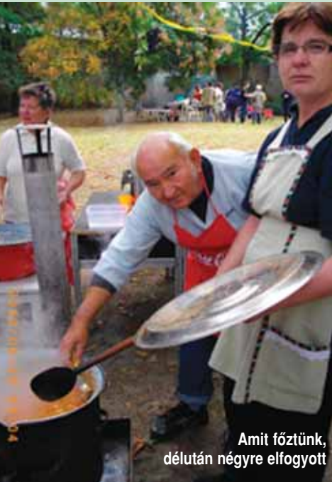
Amit főztünk, délután négyre elfogyott