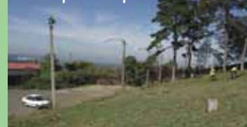
Idé telepítik a napelemeket

Ütemterv szerint halad a napelem rendszer telepítése a Székely Bertalan Általános Iskola területén. A közbeszerzési eljárásban kiválasztott gödöllői vállalkozással augusztus 24-én kötötték meg a szerződést. A beruházás lát-