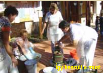
Így készült a must