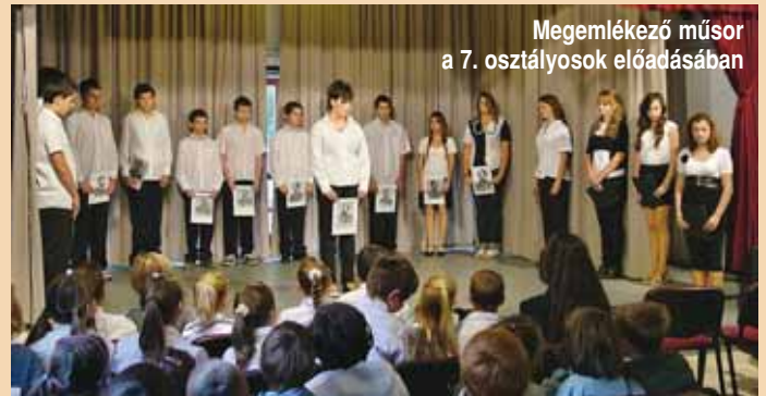
Megemlékező műsor a 7. osztályosok előadásában