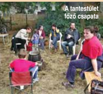
A tantestület főző csapata