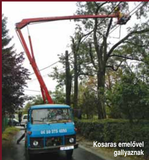
Kosaras emelővel gallyaznak

Kérjük a lakosságot, hogy amennyiben olyan fákat látnak, amik villanyvezetékre, útra, kerítésre, vagy magántulajdonra veszélyt jelentenek, akkor jelezzék irodánkban 06-70-317-9128 telefonszámon vagy a szadanova@freemail.hu e-mail címen!