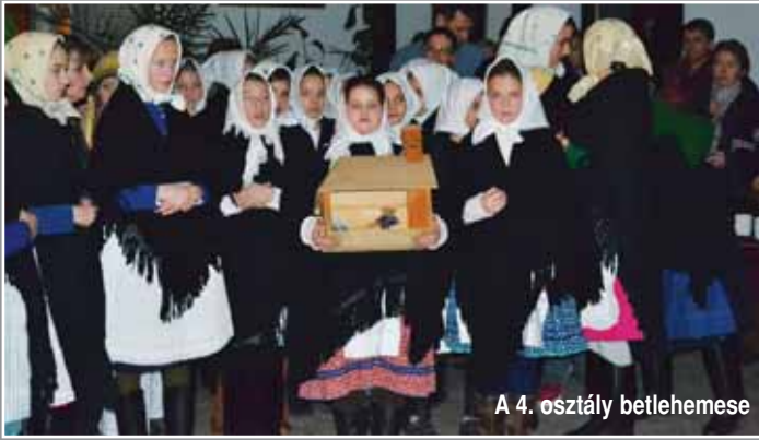
A 4. osztály betlehemes