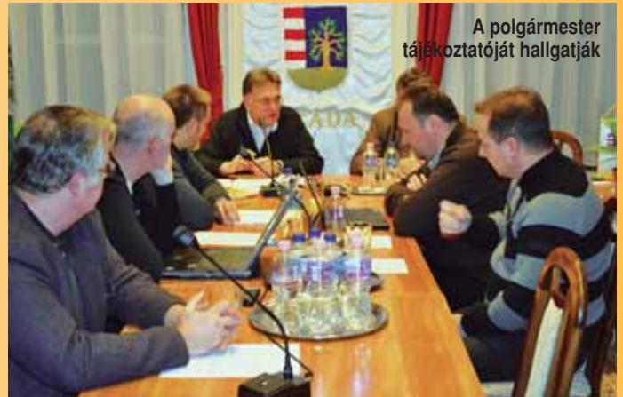
A polgármester tájékoztatóját hallgatják

ra egy kimutatást kért a Műszaki Osztálytól, hogy hány ingatlantulajdonos nem csatlakozott a rendszerre és hány olyan ingatlan létezik a településen, ahol műszaki problémák miatt nem tudtak rákötni.