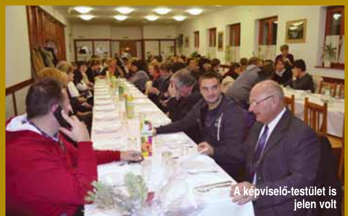
A képviselő-testület is jelen volt