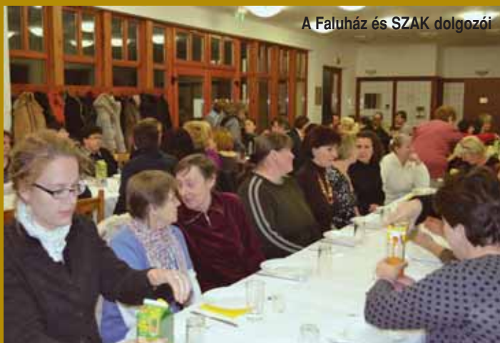
A Faluház és SZAK dolgozói