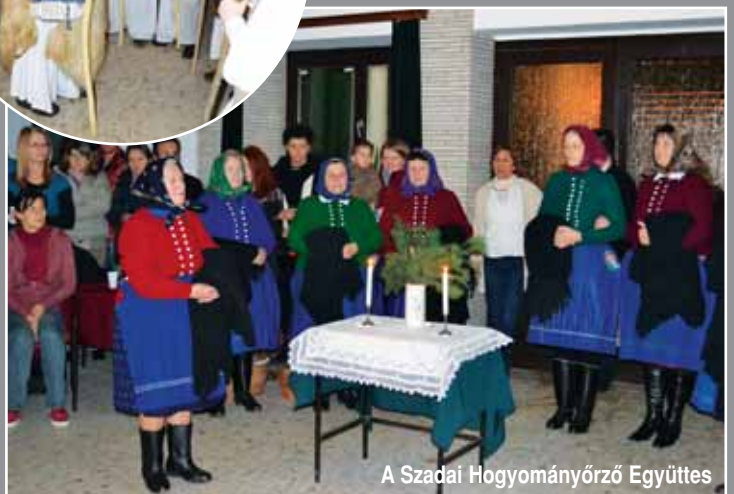
A Szadai Hogyományörző Együttes