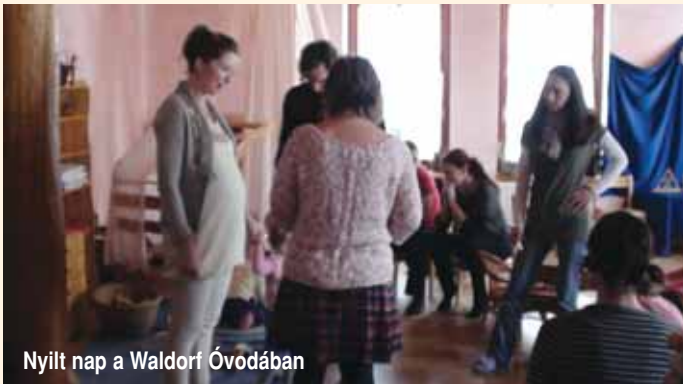
Nyílt nap a Waldorf Óvodában