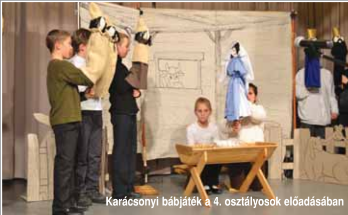
Karácsonyi bábjáték a 4. osztályosok előadásában