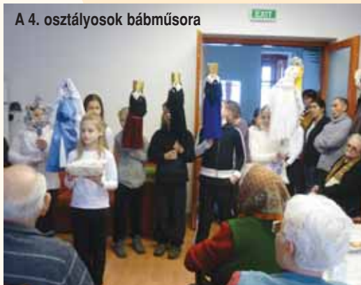
A 4. osztályosok bábműsora