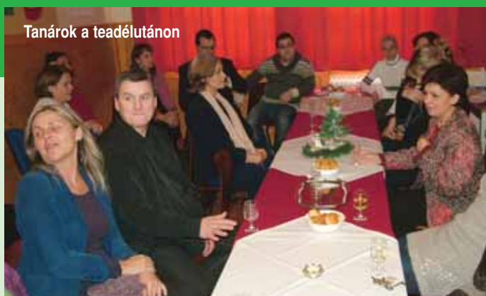
Tanárok a teadélutánon

tálykarácsonyt, ajándékokkal és finom süteményekkel. Ebéd előtt pedig az udvaron láthattuk a betlehemet.