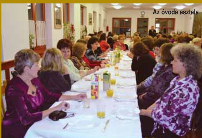
Az óvoda asztala