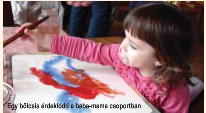
Egy bölcsis érdeklődő a baba-mama csoportban

A lig indult el az év, de a szadai Meseház Waldorf Óvodában már javában zajlanak a sokszínű mindennapok. Az alacsonyán járó téli nap besüt előbb a Napkeleti, majd a Napnyugati terem hat-hat ablakán, megcsillan egy üvegdíszben, ettől pedig szívárvány táncol odabent a gyerekek nagy örömeire. A napugár ezután kíváncsian beragyogja a csoportszobákat, és látja például, hogy az iskolába készülők neki kezdtek a munkájuknak. Vagyis a lányok és a fiúcskák is szövessel, fával kézműveskedve készülnek a nagy fordulóra, az iskolába lépésre. Odakint a sok havazástól minden hófehér, természetes, hogy nap mint nap száncóznak, hógolyóznak a gyerekek és az óvónők a kellemes lankán az ovi mögött. De az erdő ölelésében álló ovi udvarán is nagy a jóvámenés. Leginkább a levegőben. Merthogy az óvodások naponta szórnak eledelet az erdő-mező madarainak, az idelátogató feketeigók, széncinegék, ökörszemek és társaik nagy örömeire.