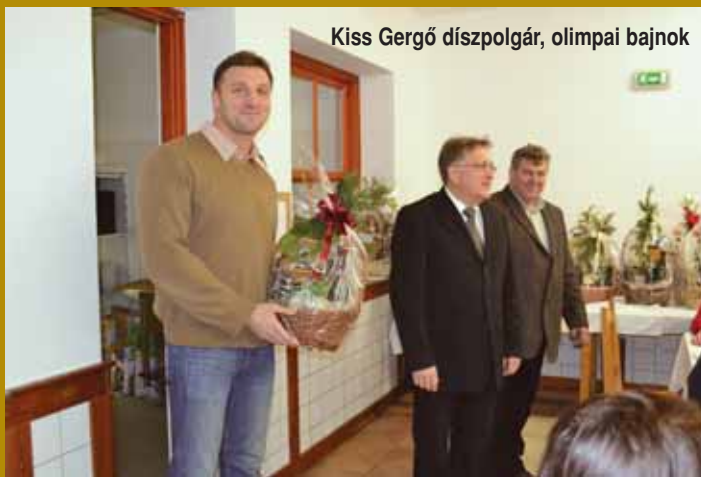
Kiss Gergő díszpolgár, olimpiai bajnok