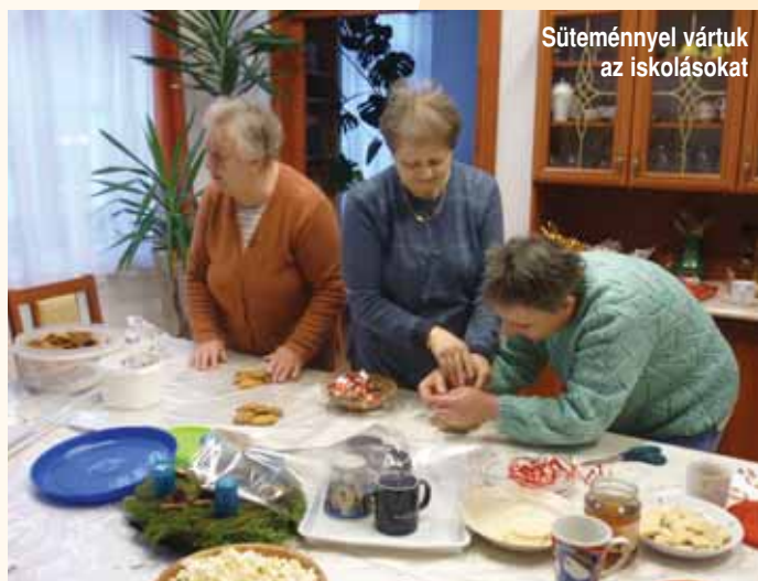
Süteménnyel vártuk az iskolásokat