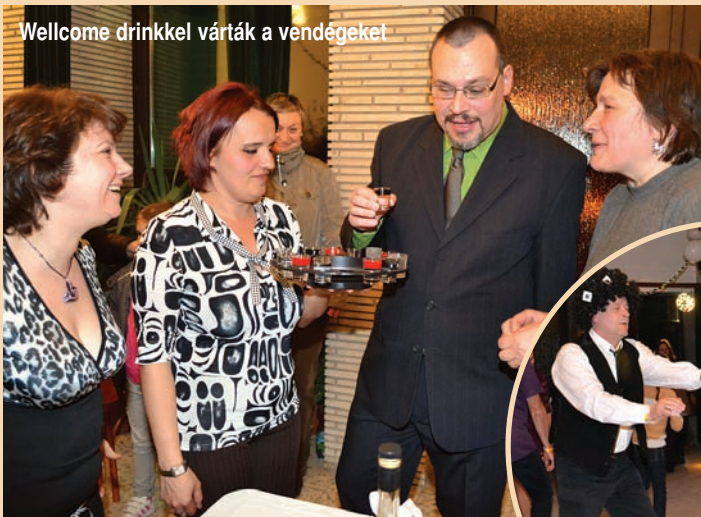
Wellcome drinkkel várták a vendégeket