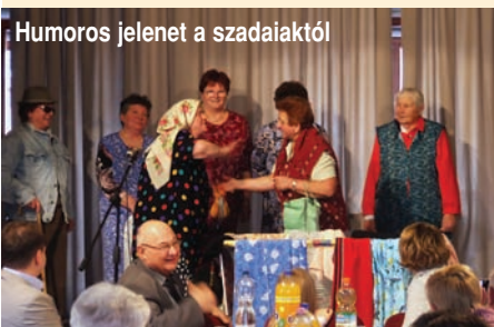
Humoros jelenet a szadaiaktól