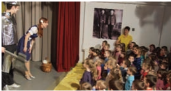
Őz a csodák csodája címen április 9-én délelőtt a Napraforgó Meseszínház nagysikerű előadást tartott a Faluházban