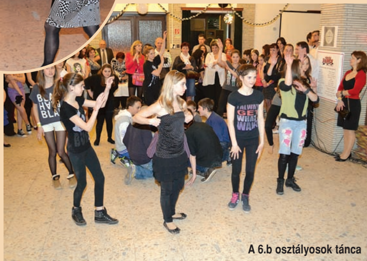
A 6.b osztályosok tánca