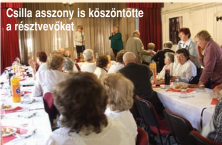
Csilla asszony is köszöntötte a résztvevőket