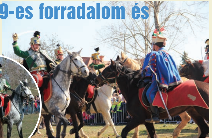
Szadai gyerekek a huszárbemutatón