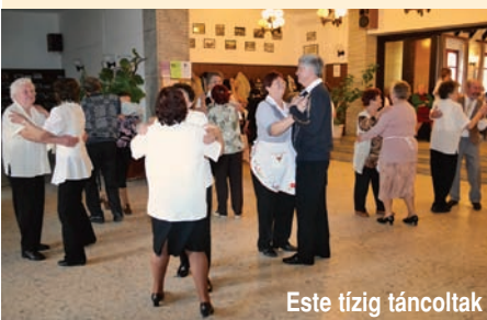
Este tízig táncoltak