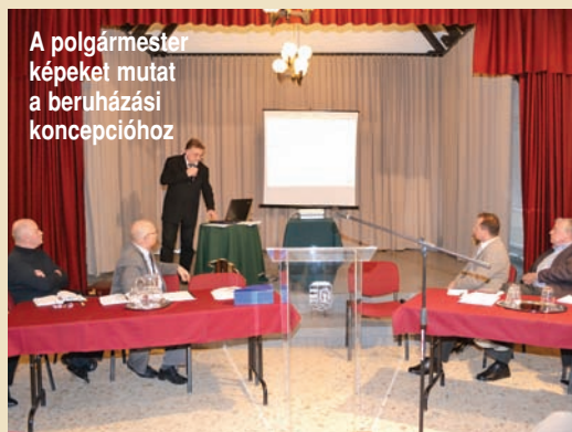
A polgármester képeket mutat a beruházási konceptióhoz