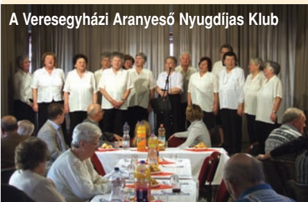
A Vereseygházi Aranyeső Nyugdíjas Klub