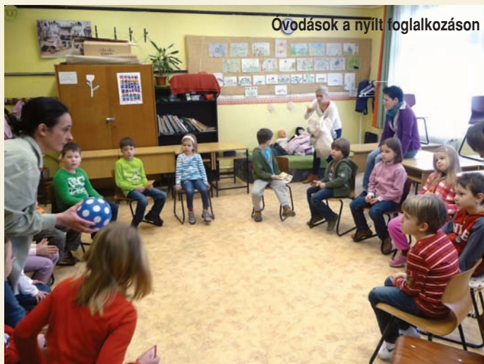
Óvodások a nyílt foglalkozáson