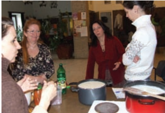
Sajtkészítés a Biokuckóban március 23-án délelőtt