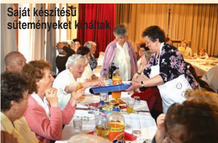
Saját készítésű süteményeket kínáltak