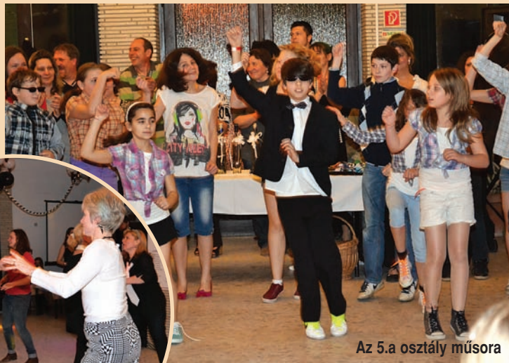
Az 5.a osztály műsora