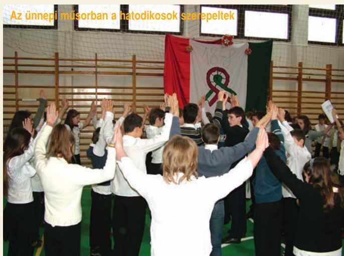
Az ünnepi műsorban a hatodikosok szerepeltek