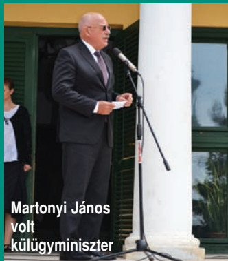
Martonyi János volt külgügyminiszter