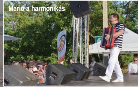
Marió a harmonikás