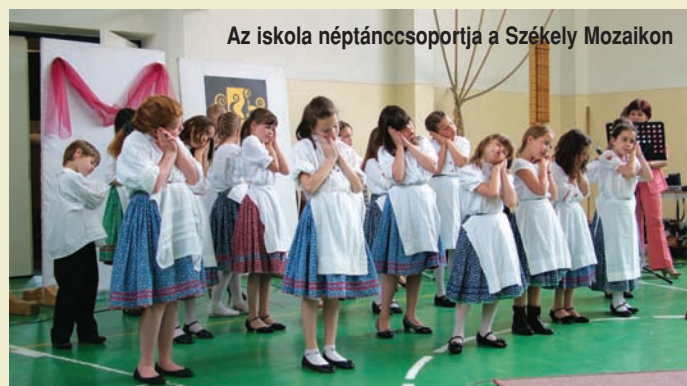
Az iskola néptáncsoportja a Székely Mozaikon