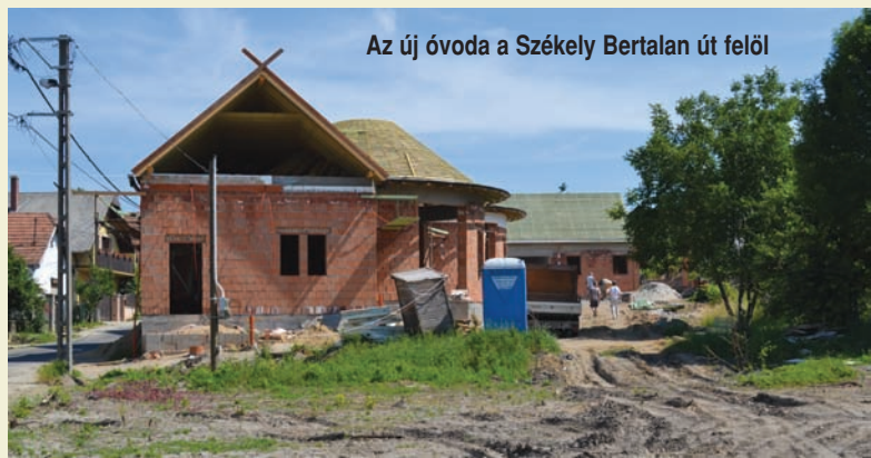
Az új óvoda a Székely Bertalan út felől

A pályázat célja: a Székely Bertalan út 5. sz. alatt található kis tér elnevezése.