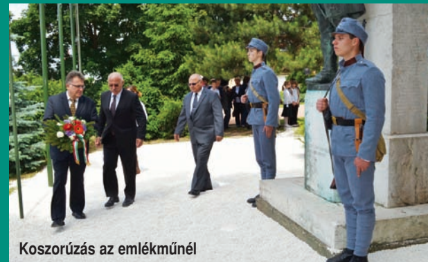
Koszorúzás az emlékműnél