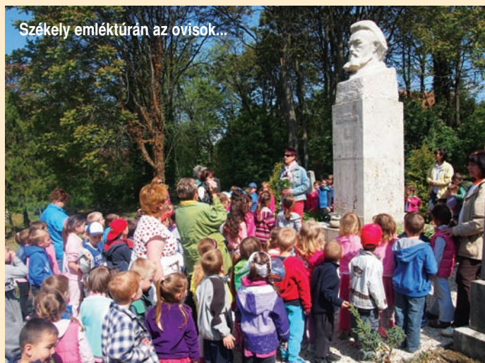
Székely emléktúrán az ovisok...