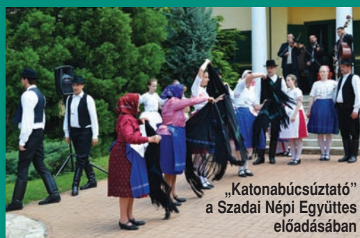
„Katonabúcsúztató” a Szadai Népi Együttes előadásában