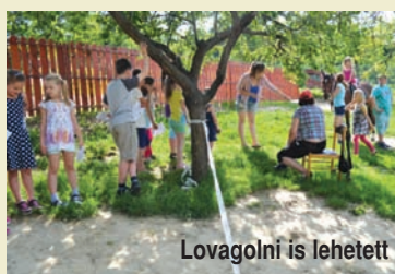
Lovagolni is lehetett