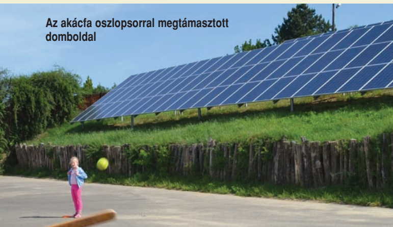
Az akácfa oszlopsorral megtámasztott domboldal

A Székely Bertalan Általános Iskola sportpályának északi oldalán a domboldalt egy akác oszlopsoros támfal tartja, ami kezd elkorhadni. Az oszlopsor kiváltására egy vasbeton cölöprendszer kell építeni, ami nagy biztonsággal tartaná meg a felette lévő napkollektoros területet is. Az önkormányzat a Botond 99 Kft.-től kapta a legkedvezőbb ajánlatot. A fenti munkálatok kivitelezésére 4.820.000 Ft+Áfa összeget biztosít az önkormányzat.