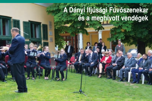
A Dányi Ifjúsági Fúvószenekar és a meghívott vendégek