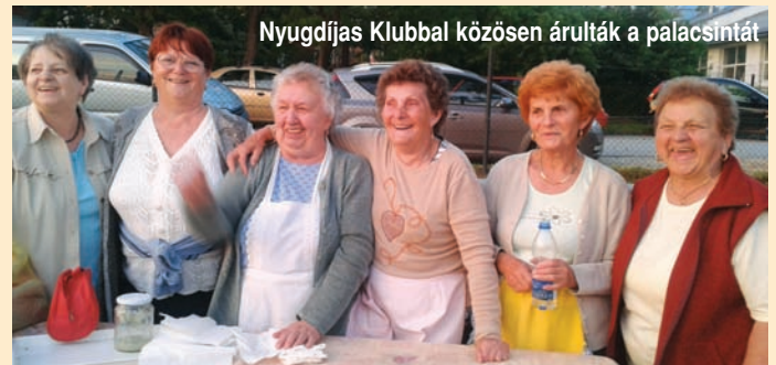
Nyugdíjas Klubbal közösen árulták a palacsintát

Másnap megtekintettük a Múteremházban Székely Bertalan és Lotz Károly Felhőtanulmányok című kiállítását.