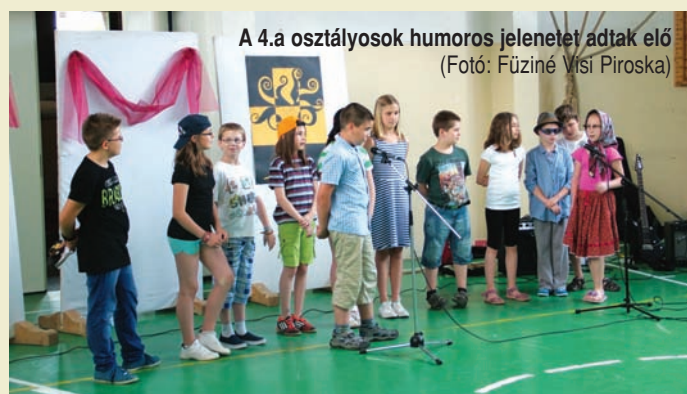
A 4.a osztályosok humoros jelenetet adtak elő