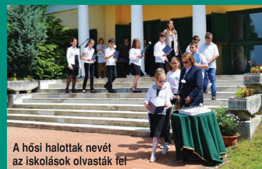
A hősi halottak nevét az iskolások olvasták fel