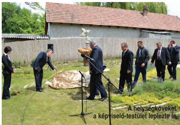
A helységköveket a képviselő-testület leplezte le