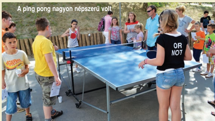
A ping pong nagyon népszerű volt