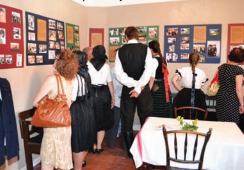
A kiállítás képei a Tájházban