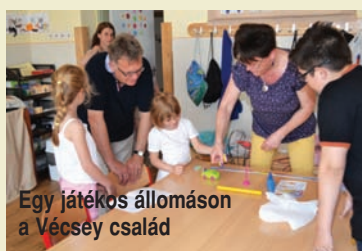
Egy játékos állomáson a Vécsey család