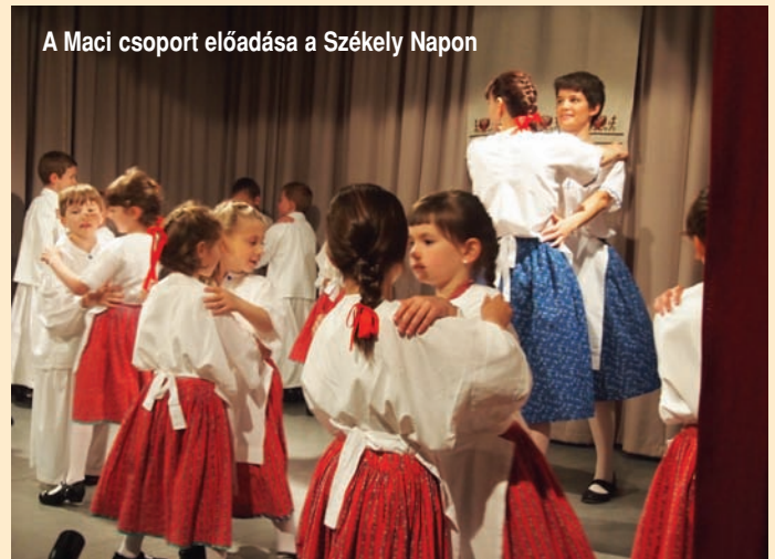
A Maci csoport előadása a Székely Napon

A Katica csoport egész hónapban csak röpködött. Több családhoz voltak hivatalosak a napokban, így reggeli után felkerekedtek, és