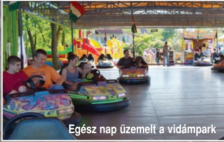
Egész nap üzemelt a vidámpark