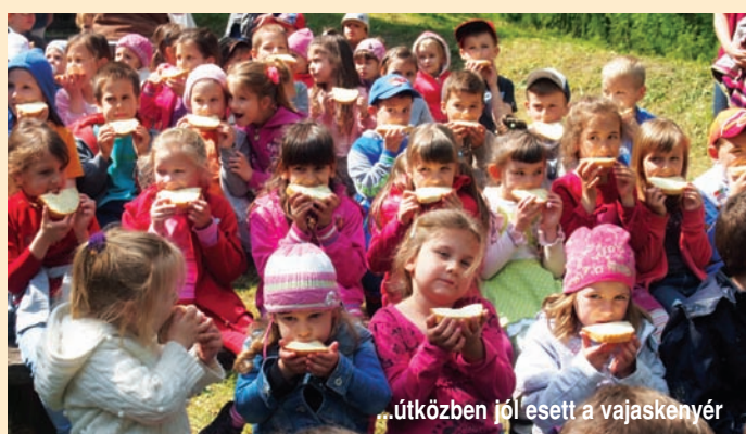
...útközben jól esett a vajaskenyér