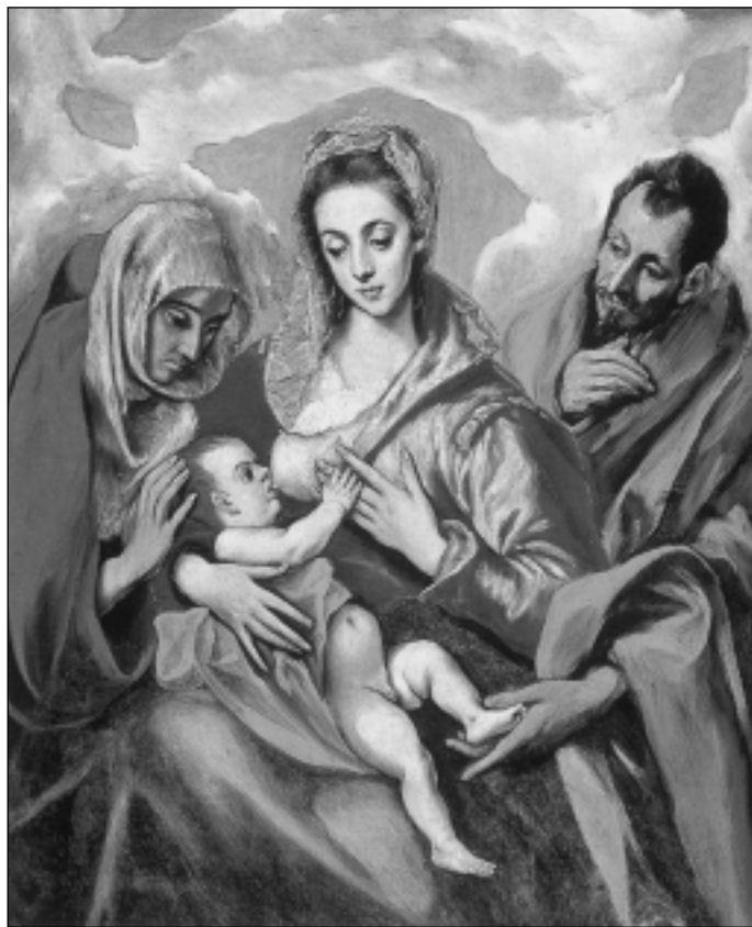
EL GRECO: Szoptató Mária (Tavera kórház Toledó, 1595. év)

A kényelmes helyen pihenő vendégek nem tudták, hogy mi történik az ő barmaik istállójában... Több mint kétezer év telt el azóta, és mi már arról is tudunk, ahogyan a Megváltó itt hagyta ezt a bűnös világot, hogy egy jobb helyet készítse a benne hívőknek az Atyjának országában.