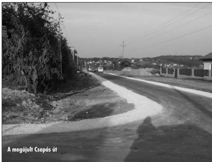
A megújult Csapás út