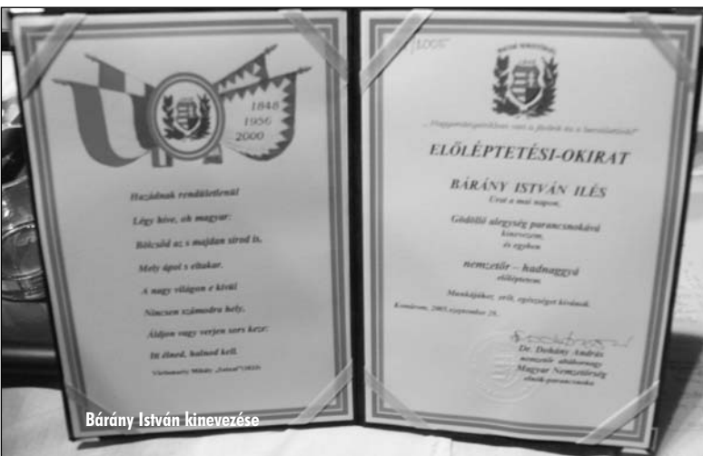
Bárány István kinevezése