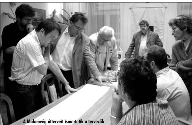
A Malomvég útterveit ismertetik a tervezők