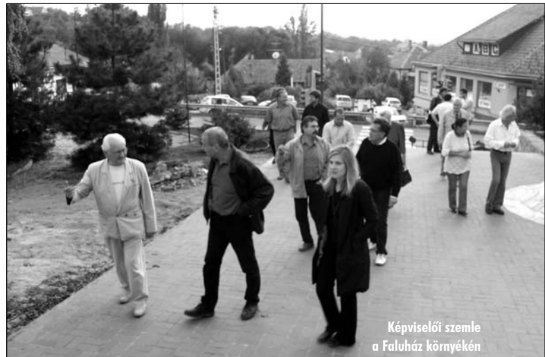
Képviselői szemle a Faluház környékén

A képviselő-testület egyetértett abban, hogy a Hungaroring Környéki Települések Önkormányzatainak Társulása pályázatot nyújtson be a