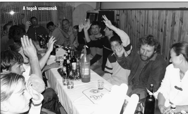
A tagok szavaznak