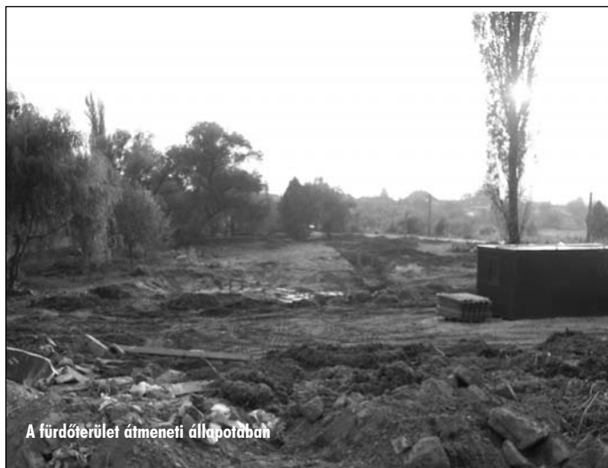
A fürdőterület átmeneti állapotában