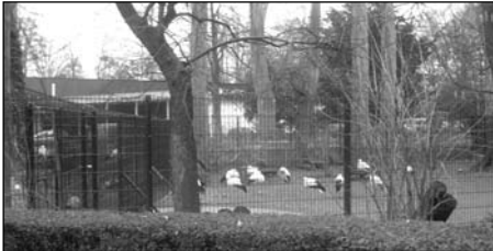
Gólyák téli szállása az Európa Parlament közelében. A gólya Elzász címerállata

tásai, a kontinenst átszövő prostitúció és kábítószerezlet, a nők közéleti szerepvállalása, s bizony olykor az egyes országok közötti konfliktusok is felszínre bukkantak.