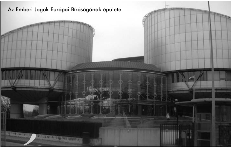
Az Emberi Jogok Európai Bíróságának épülete

És valóban, mint ez a város ókori eredetű germán elnevezéséből is kitűnik, Strasbourg az európai történelem fő kulturális és gazdasági áramlatainak észak-déli és kelet-nyugati metszéspontjában helyezkedik el. Már a rómaiak is tisztában voltak stratégiai fontosságával, s az Ill folyó Nagy Szigetére építették erődítményeiket és városukat. Ennek helyén alakult ki évszázadok alatt a mai Strasbourg belvárosa, benne olyan kultúrtörténeti csodákkal, mint a Katedrális, amely lenyűgöző méreteivel, csipke finomságúra faragott köveivel ma is az ég felé fordítja a hívő és a hitetlen lelket egyaránt. A város viharos történelme során gyakran cserélt gazdát, s Elzász-Lotharingia vezető városaként a kibékíthetetlen francia-német szembenállást testesítette meg.