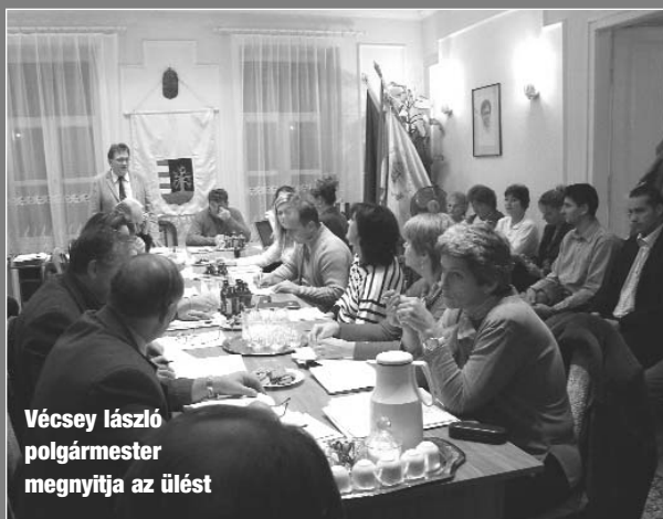
Vécsey László polgármester megnyitja az ülést