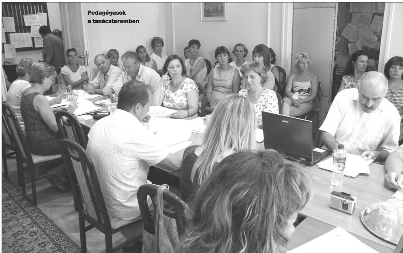
Pedagógusok a tanácsteremben