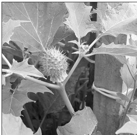
A maszlag levelei, virága, tüskés termése, mely a veszélyes magvakat tartalmazza jól felismerhető

Levélírónk elgondolkodtató és cselekvésre indító levelét teljes terjedelmében megküldtük az érintett bevásárlóközpont vezetőjének. Itt azonban helyszűke miatt, csak részleteket tudunk megjelentetni. – a szerk.