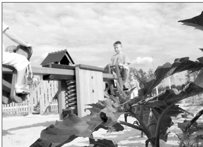
No comment... Vagy: A játszótéren ő is jól érzi magát...