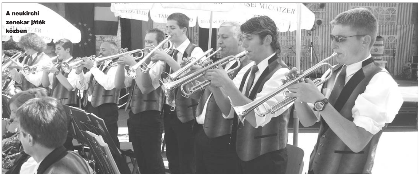
A neukirchi zenekar játék közben