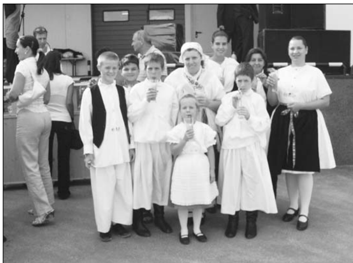
A szadai hagyományörző együttes egy csoportja