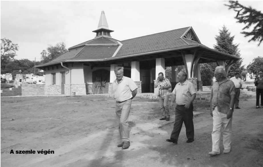
A szemle végén