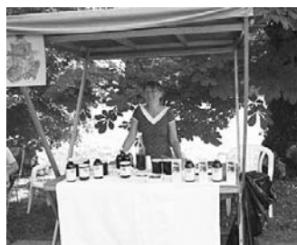
Itt tessék kóstolni a gyümölcskészítményeket...