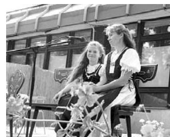
A szadai népmesemondók