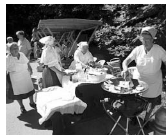
Lepénysütés közben a szadai asszonyok