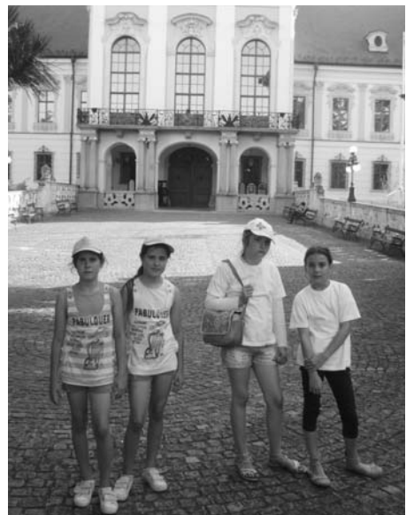
Edelényi gyerekek a kastélyban