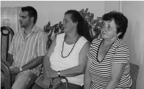
Vendégek az ülésen

megtakarításból törlesztenék le számukra az összeget. A képviselők azonban további részleteket kívántak megismerni a döntés előtt.