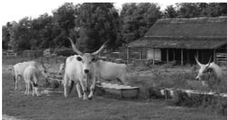
A Nordénia gulyáját megvásárolta Veresegyház Önkormányzata, amely most a Medveotthon mellett látogatható. A cég néhány marhát azért visszatartott, íme a maradék.