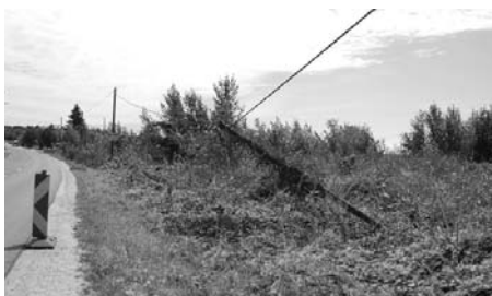
Vagy az oszlop tartja a vezetékét, vagy fordítva.