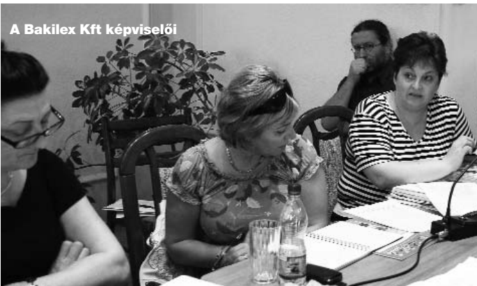
A Bakilex Kft képviselői

A településközpont hasonló nagyságrendű beruházása miatt átmenetileg még nehezebb lesz a parkolás az iskola bejárata előtt, ezért a Szada Nova Kft előrelátóan rendbe teszi a COOP épület mögötti üres telket, hogy azt is igénybe vehessék a gépkocsival közlekedők.