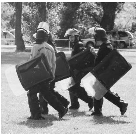
Tömegoszlató rendőrök, de a Sportnapon csak bemutatót tartottak.