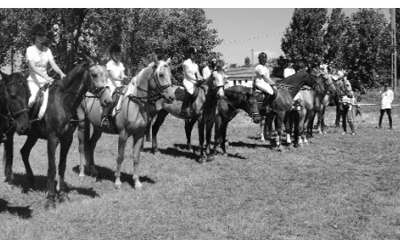
Pályaverseny eredményhirdetés a Sportnapon.