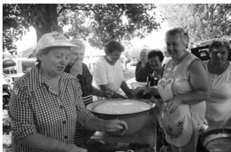
Előkészületek a sportnapra lángos sütéshez.