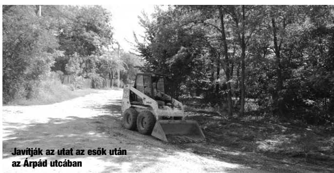
Javítják az utat az esők után az Árpád utcában