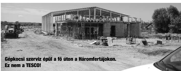
Gépkocsi szervíz épül a fő úton a Háromfertőjokon. Ez nem a TESCO!

Szada, Széchenyi u. 11. (Borostyán étterem mögött) 20/919-4343