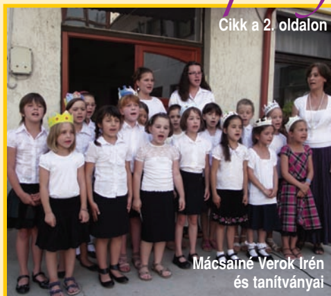
Cikk a 2. oldalon