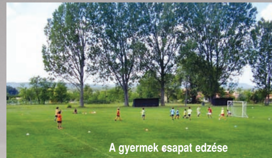
A gyermek csapat edzése