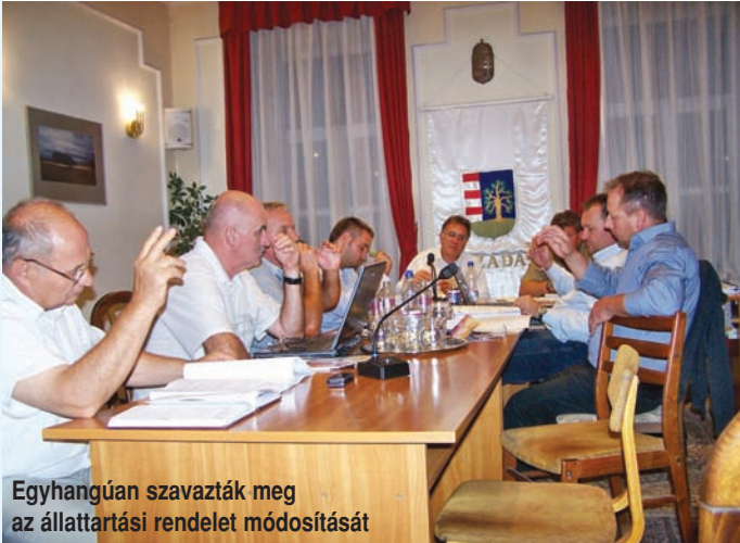
Egyhangúan szavazták meg az állattartási rendelet módosítását