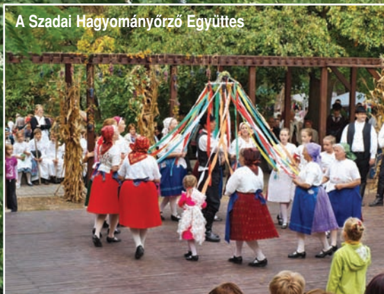
A Szadai Hagyományörző Együttes

X. ÉVFOLYAM • 9. SZÁM • 2012. SZEPTEMBER