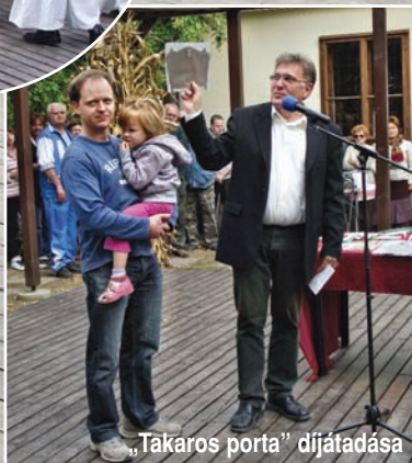
„Takaros porta” díjátadása