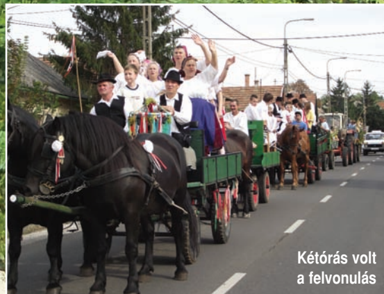
Kétórás volt a felvonulás