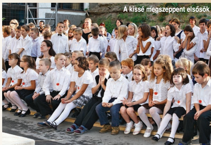
A kissé megszeppent elsősök