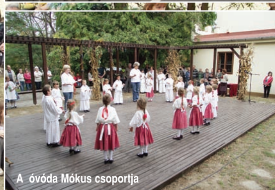
A óvoda Mókus csoportja