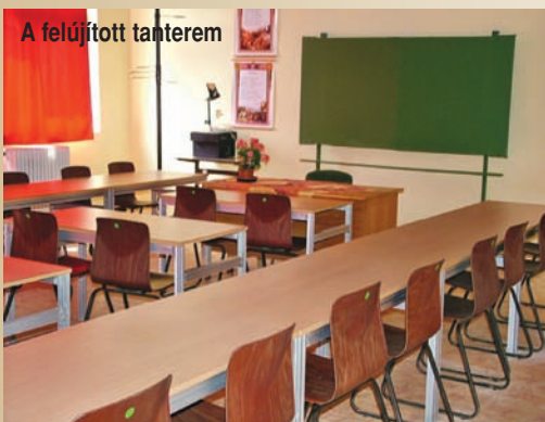
A felújított tanterem

A pedagógusok már augusztus utolsó hetében megkezdték a munkát, hogy az ős kezdetén visszatérő gyerekeket ismét szép és otthonos környezet fogadja. A falakra dekorációk kerültek, a földszinten és a második emeleten új ülőalkalmatosságok és fogasok várták őket. A termek és a mosdók ajtajára új táblácskák kerültek.