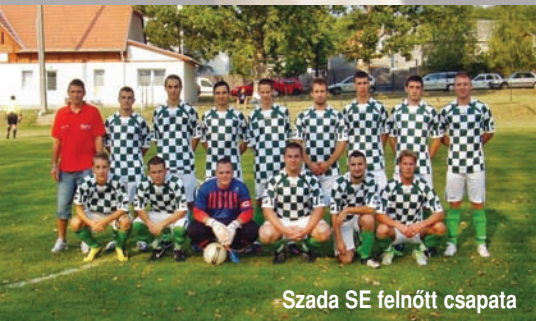
Szada SE felnőtt csapata