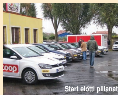
Start előtti pillanat

A CO-OP Hungary Zrt. kezdeményezése kiváló alkalmat teremt arra, hogy a kétnapos autós vetélkedőn résztvevő vállalatok képviselői a verseny során és az azt kísérő kötetlen találkozók