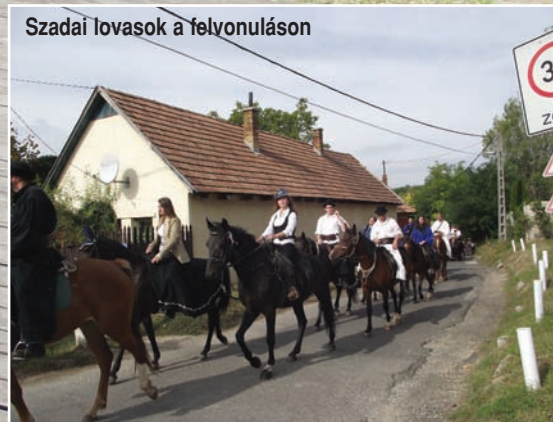
Szadai lovasok a felvonuláson