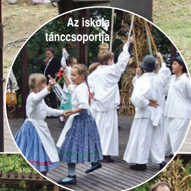
Az iskola táncsoportja