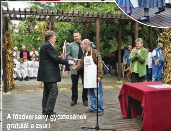
A főzőverseny győztesének gratulál a zsűri