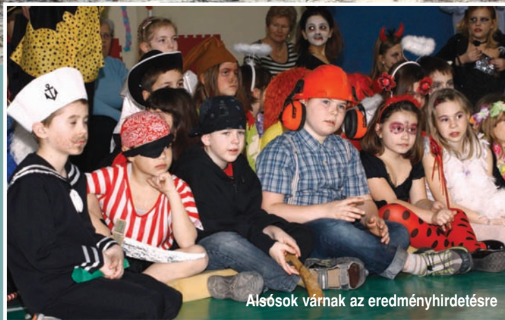
Alsósok várnak az eredményhirdetésre