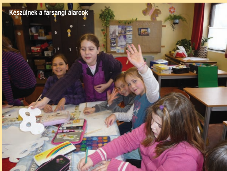
Készülnek a farsangi álarcok

Február 8-án ismét állt a bál az iskolában. Az alsósok lelkesen készülődtek és várták a nagy napot. Nem kevesebb izgalommal telt a nap a felsősök számára sem, hiszen a 8. osztályosok palotás nyitó-táncja is elmaradhatatlan esemény.