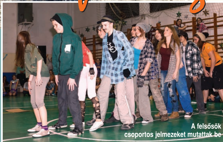
A felsősök csoportos jelmezeket mutattak be

4. oldal Pályázati pénzből szeretné Szada a közvilágítást korszerűsíteni 5. oldal Elfogadták a település 2013. évi költségvetését 6. oldal Interjú Dr. Illés Zoltán államtitkárral