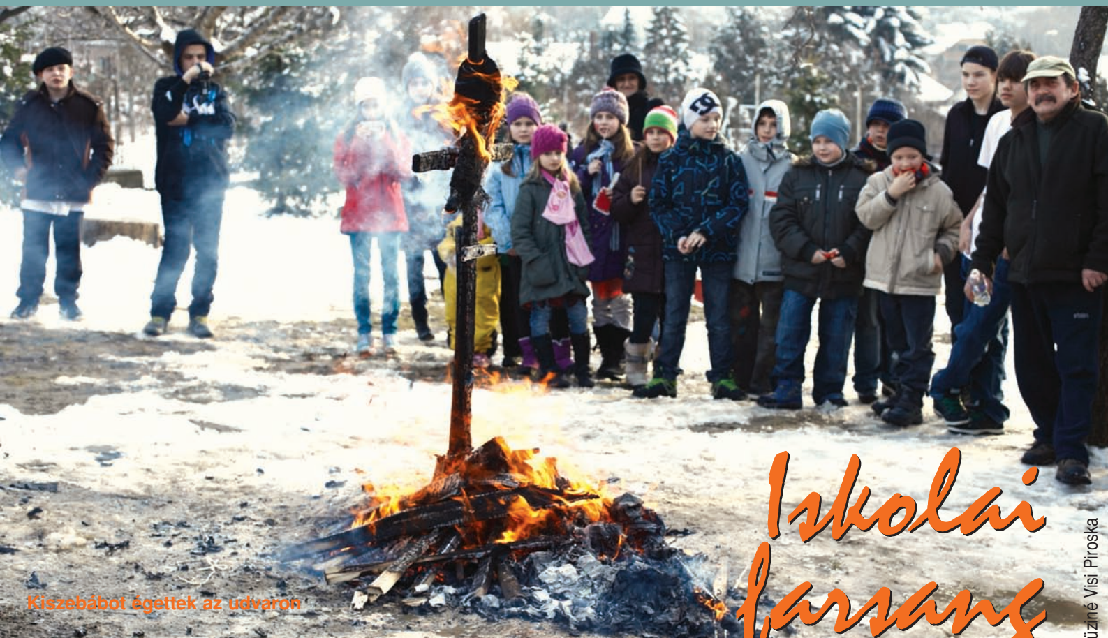
Kiszebábot égettek az udvaron