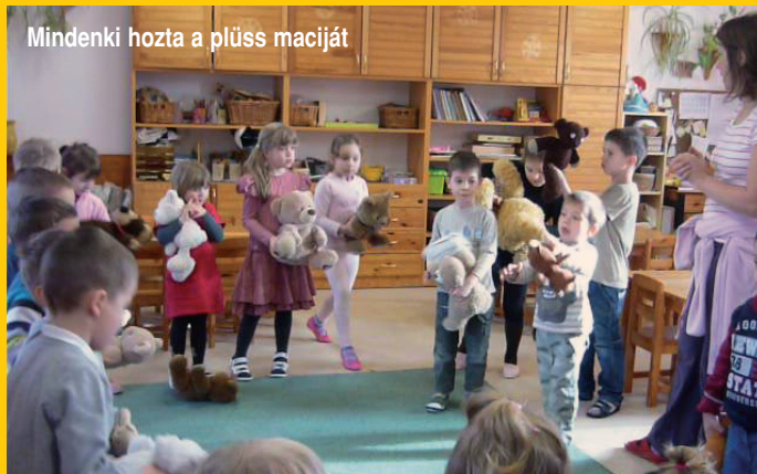
Mindenki hozta a plüss maciját

Február 6-án elérkezett a gyerekek várva várt eseménye a téliző farsang. Már hetekkel korábban tervezgették, mondogatták, hogy minek is fognak beöltözni e jeles napon. A reggeli érkezéskor szülei segítségével átöltöztek, majd megcsodálták egymás jelmezét, mindenki nagyon jól mutatott a saját maskarájában, átlényegülve mutatkoztak be a többieknek. Ez a nap arra is alkalmat adott, hogy megismerjük egymás viccesebb, tréfásabb oldalát. A mókából az óvó nénik, dajka nénik se maradtak ki, ők is beöltöztek különböző jelmezekbe. A szokásoknak megfelelően a szülők is aktívan részt vettek az óvodai farsangban, ők sütötték a fánkot és a finomabbnál finomabb süteményeket.