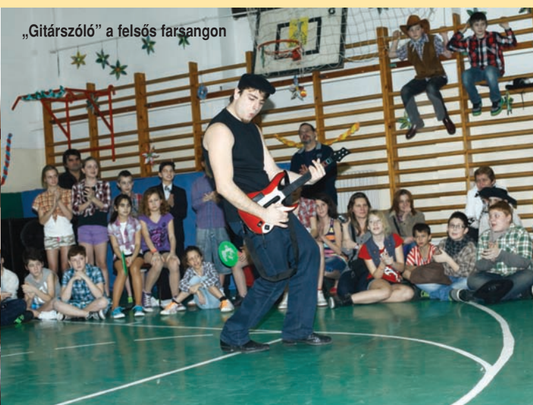
„Gitárszóló” a felsős farsangon

Januárban megrendezésre került a területi döntő a Faluházban. Köszönjük az önkormányzat anyagi támogatását. A Faluházban számos környékbeli iskola növendéke gyűlt össze, akik egy kellemes