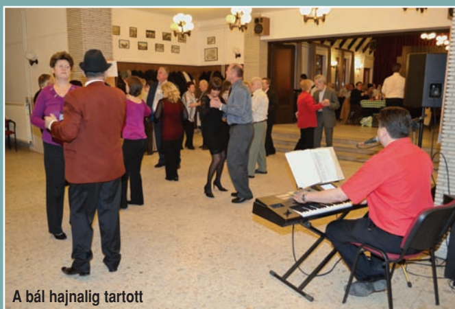
A bál hajnalig tartott