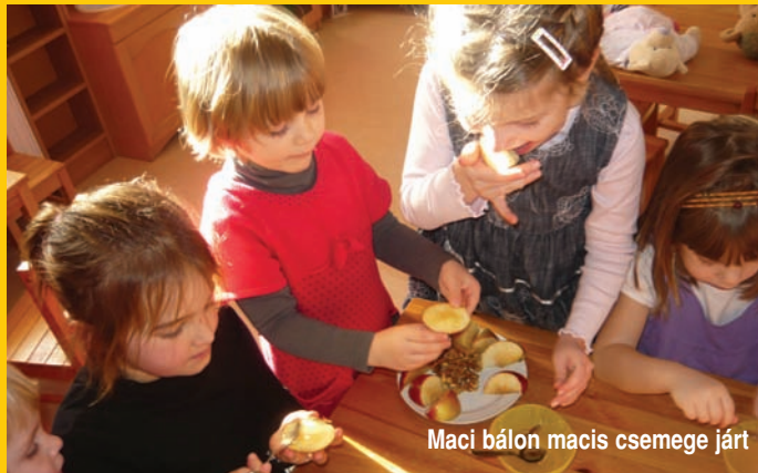
Maci bálon macis csemegé járt