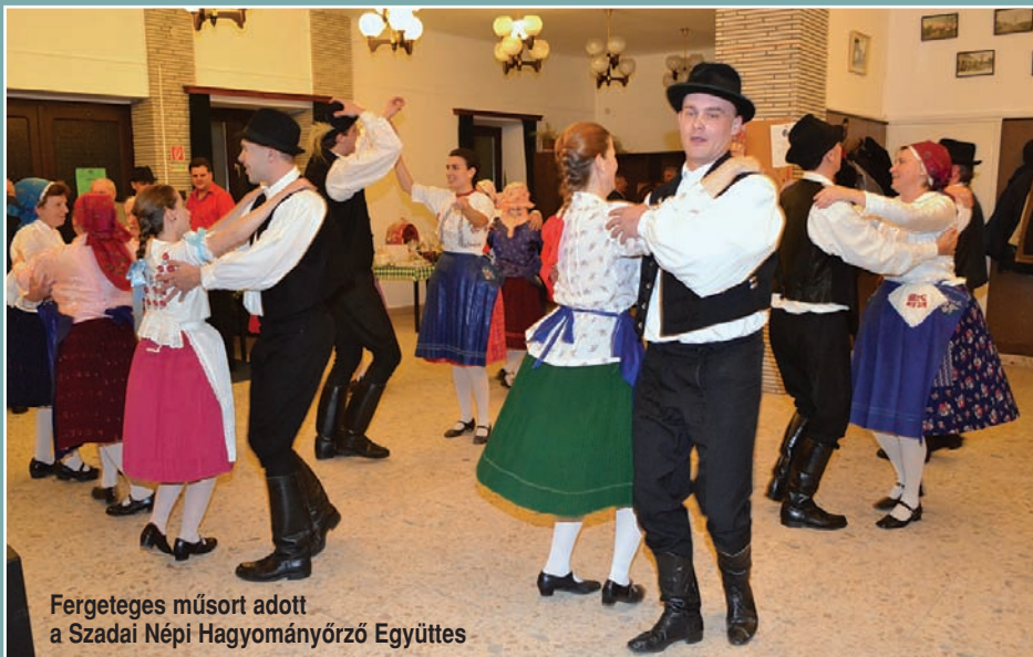
Fergeteges műsort adott a Szadai Népi Hagyományőrző Együttes