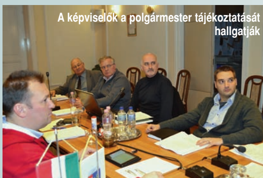
A képviselők a polgármester tájékoztatását hallgatják