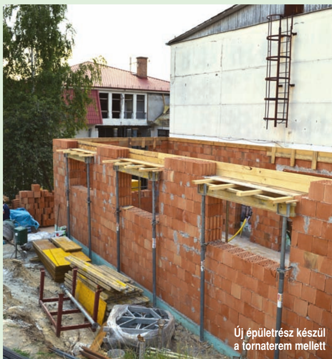
Új épületrész készül a tornaterem mellett