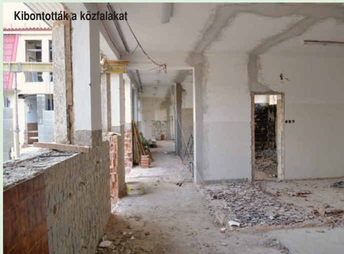
Kibontották a közfalakat