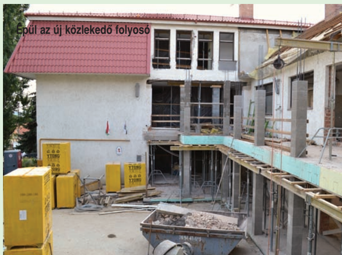
Épül az új közlekedő folyosó

A megnövekedett tanulólétszámnak köszönhetően szükségessé vált az iskola bővítése. Az önkormányzat a nyáron 3 normál és egy kisebb méretű tanteremmel bővíti az iskolát. A június 14-én megtartott ballagás után elkezdte a munkát a gödöllői székhelyű Épkomplex Építőipari Szolgáltató Kft. Az épület hátsó szárnya teljesen átalakul. A bővítés a meglévő épület tantermi és tornatermi összekötő épületrészének mindhárom szintjét érinti. Az udvar felőli folyosót megszüntetik, a régi folyosó elé építenek egy új közlekedőt. A tornaterem dél-keleti falához egy új épületrész kerül. Az iskola ezen részén 544 m 2 területet építenek át. Az iskola átalakításának költsége 58 millió 800 ezer Ft + ÁFA. A kivitelezést legkésőbb szeptember 15-én kell befejezni. Az építkezést irányító Deme János építészvezető szerint, ha nem jön közbe váratlan időjárás, akkor tanévkezésre teljesen végeznek. Vécsey László polgármester elmondta, hogy a legrosszabb esetre is kidolgoztak egy forgatókönyvet. Csúszás esetén az esetleges teremgondokat a Faluház igénybevételével oldanák meg, tornaszobát ideiglenesen az étkező tetőterében alakítanának ki. A nagy átalakítással egy időben a meglévő konyha-étkező tetőtér beépítését is befejezik. A tervezett bővítéssel két oktatási különterem, vizes blokkok, tároló, közlekedő helyiségek készülnek 242,5 m 2 hasznos alapterülettel. A 13 millió forint + Áfa-ba kerülő átalakítás átadása augusztus végén várható. Mindkét beruházás saját erős, önkormányzati forrásból történik.