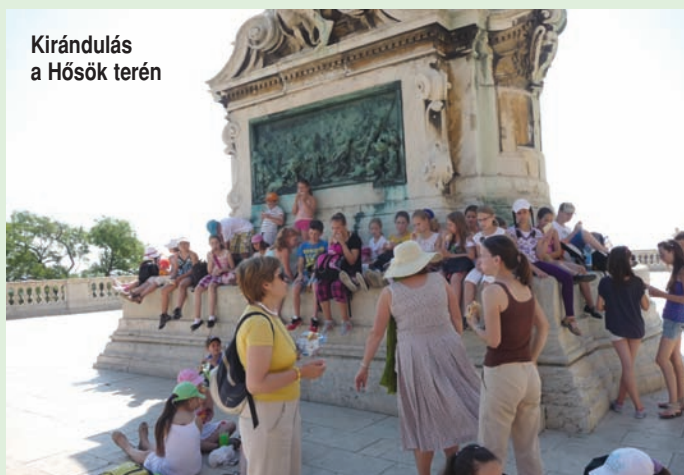
Kirándulás a Hősök terén