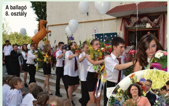
A ballagó 8. osztály