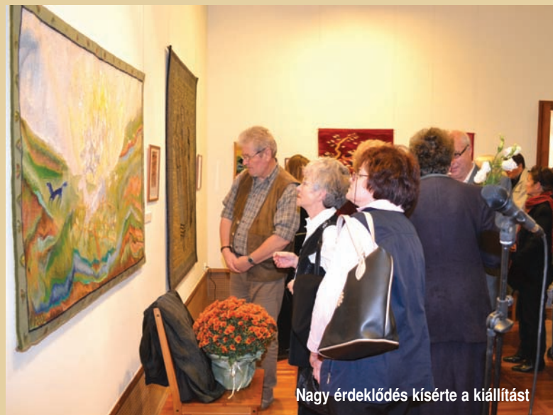
Nagy érdeklődés kísérte a kiállítást