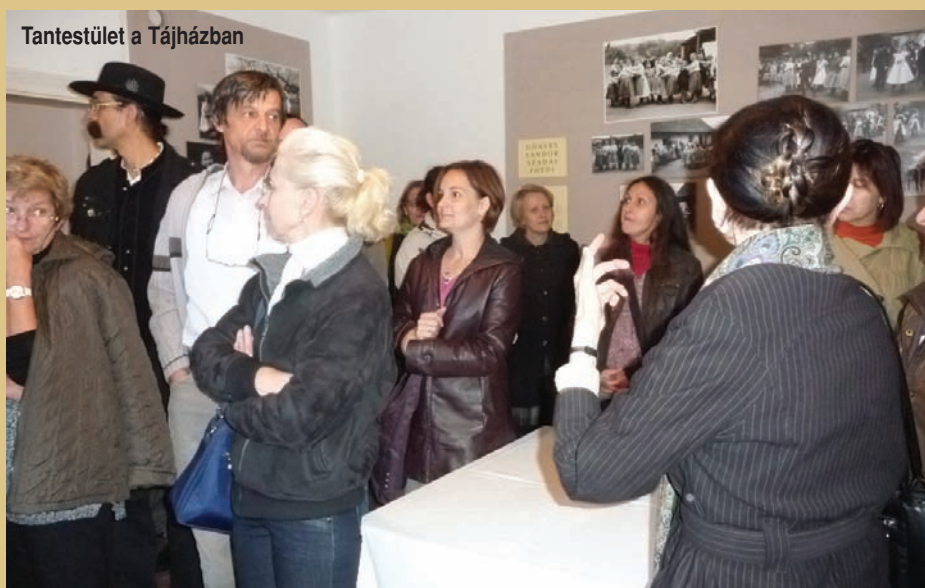
Tantestület a Tájházban