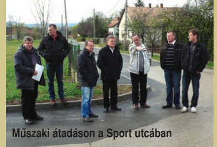
Műszaki átadáson a Sport utcában

Az 58 millió 883 ezer forintos beruházás érintette az Árpád, az Aradi, a Mátyás király, az Akácfa, a József Attila és a Sport utcát, valamint az említett ut-