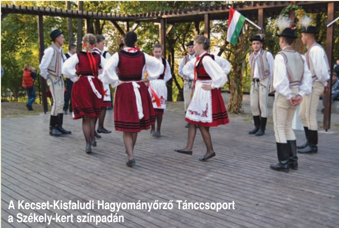
A Kecset-Kisfaludi Hagyományőrző Táncsoport a Székely-kert színpadán