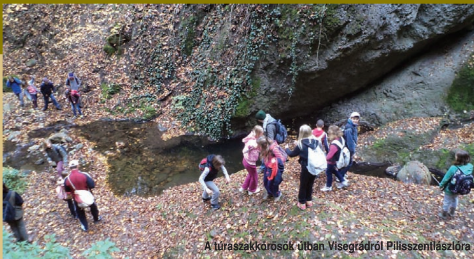
A túraszakkörösök útban Visegrádról Pilisszentlászlóra