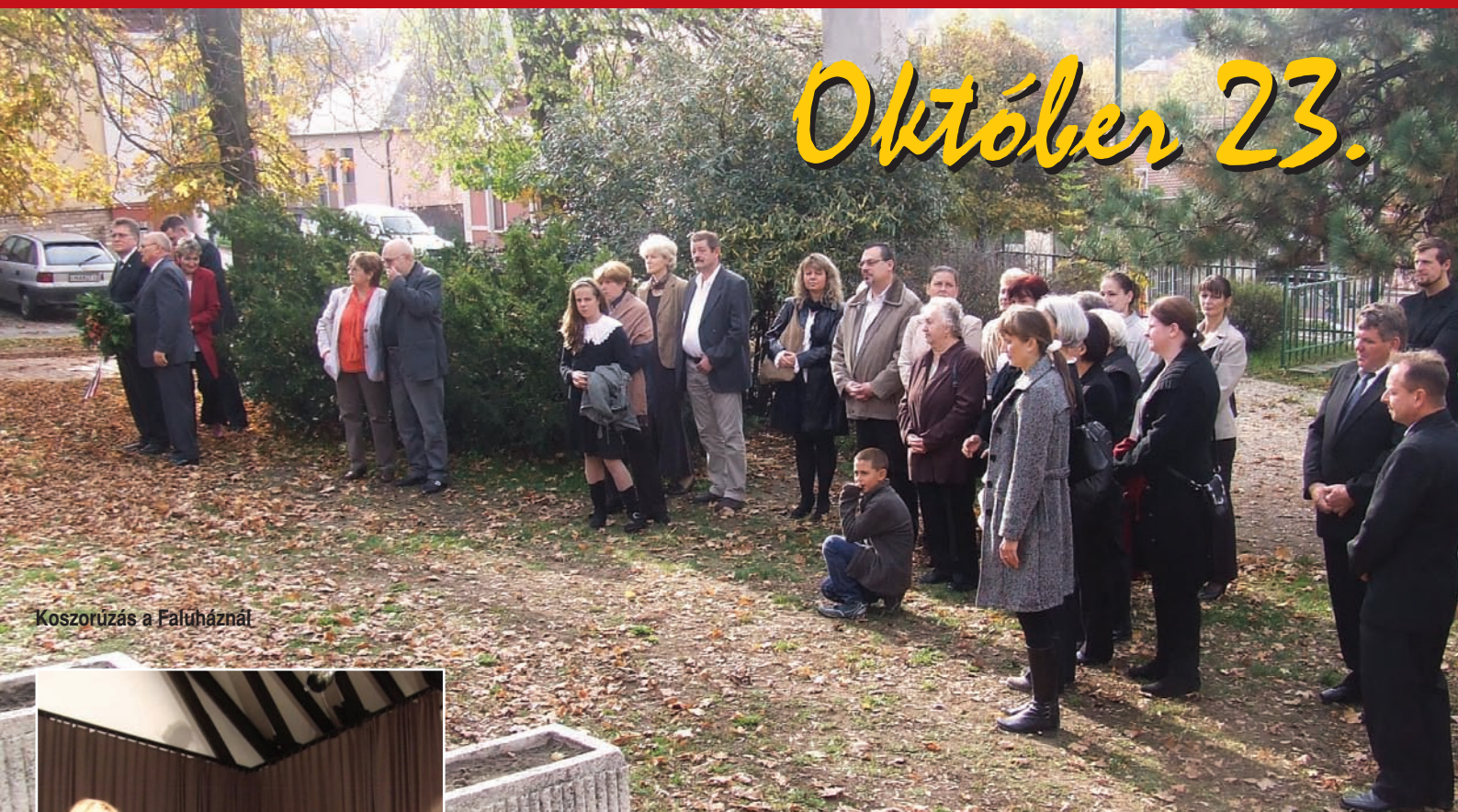
Koszorúzás a Faluháznál