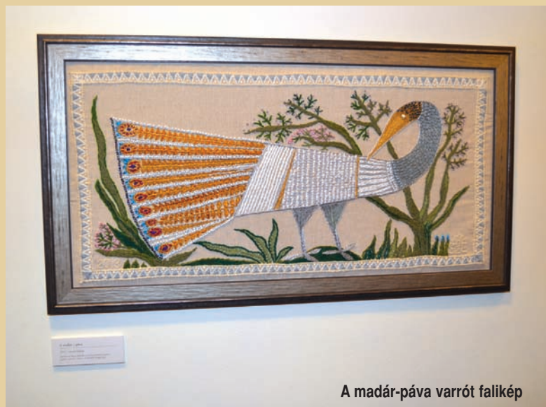
A madár-páva varrott falikép