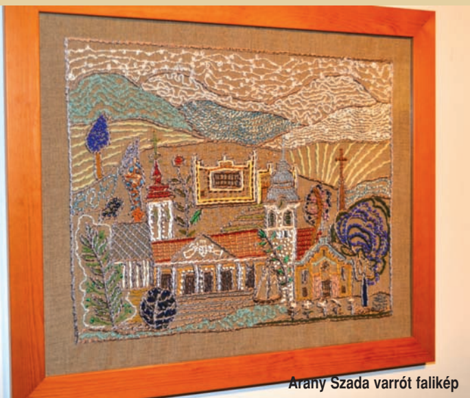
Arany Szada varrott falikép