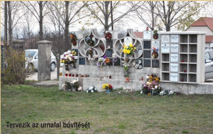
Tervezik az urnafal bővítését