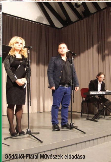
Gödöllői Fiatal Művészek előadása