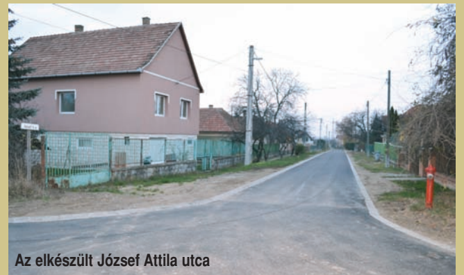
Az elkészült József Attila utca

cákat összekötő kisebb összekötő utcákat is. A felújítások az áprilisban bejelentett útépitési program részeként történtek.