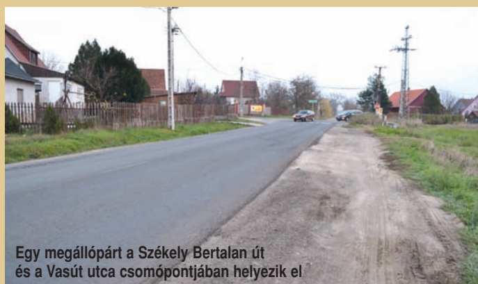
Egy megállópart a Székely Bertalan út és a Vasút utca csomópontjában helyezik el