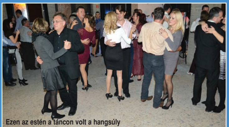
Ezen az estén a táncon volt a hangsúly