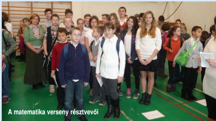
A matematika verseny résztvevői