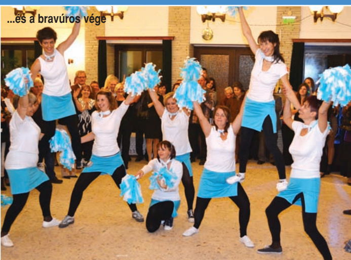
...és a bravúros vége