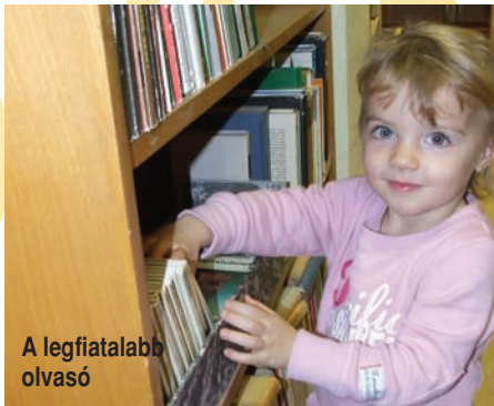
A legfiatalabb olvasó