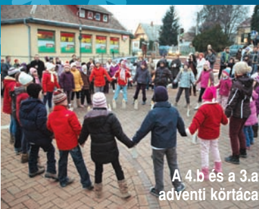
A 4.b és a 3.a adventi körtáca