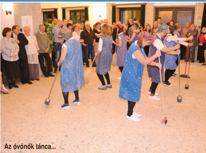
Az óvónők tánca...