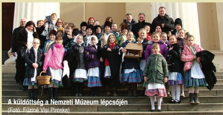
A küldöttség a Nemzeti Múzeum lépcsőjén

A képviselőjelöltté válás feltétele 500 támogató ajánlás összegyűjtése, a korábbi 750 ajánlószelevellyel szemben. A kampány az államfő által kitűzött választás napjától visszszámítva az 50. napon kezdődik.