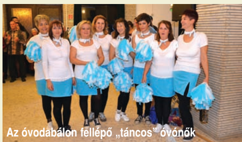
Az óvodabálon fellépő „táncos” óvónők

– a dadus nénik tányérokra rakták a szülők által sült sümeményeket,