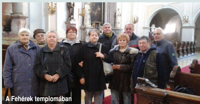
A Fehérek templomában

Katalin bált tartottunk a Faluházban , amelyre meghívtuk társklubunkat a Rád érünk 60+ Nyugdíjas Klub tagjait Órbottyánból. A zenés, táncos délelőtti jó hangulatban telt. November utolsó hetében adventre készülve, koszorúkat készítettünk, ismét szép munkák születtek.