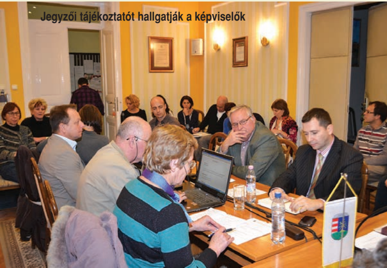
Jegyzői tájékoztatót hallgatják a képviselők