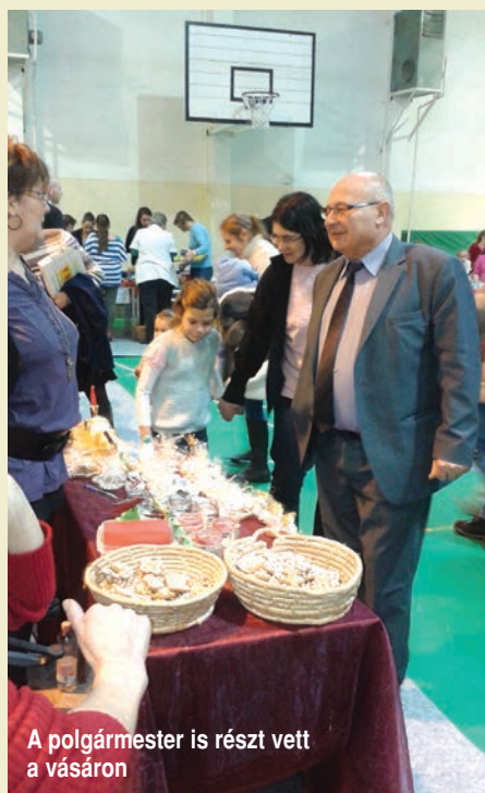
A polgármester is részt vett a vásáron