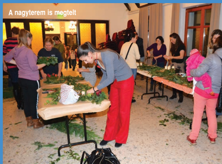
A nagyterem is megtelt