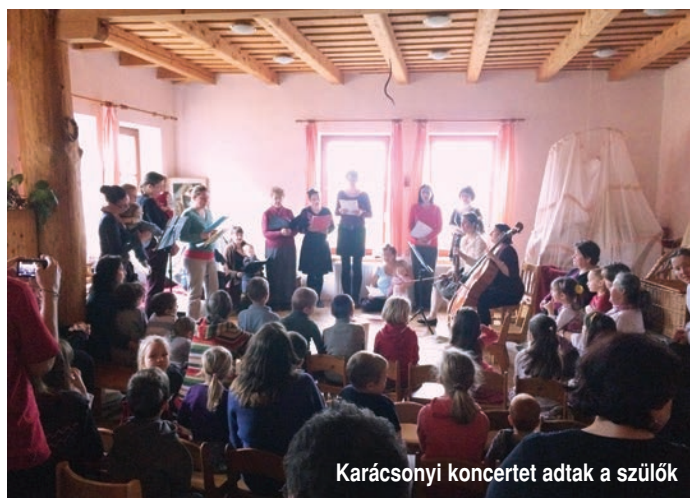
Karácsonyi koncertet adtak a szülők

Januártól pedig indulnak a nyílt napok, ezekről honlapunkon és Facebook oldalunkon adunk folyamatosan hírt.