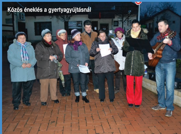
Közös éneklés a gyertyagyűjtésnél