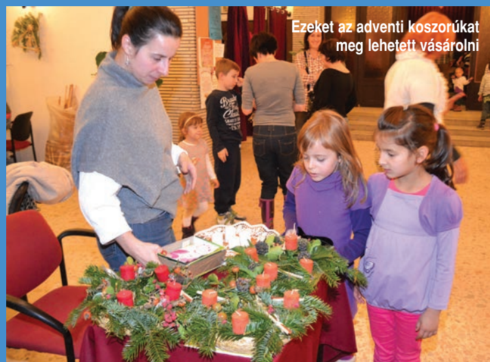
Ezeket az adventi koszorúkat meg lehetett vásárolni