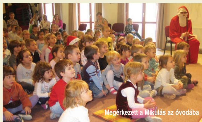
Megérkezett a Mikulás az óvodába

keknek erről a népszokásról, a hozzá tartozó hiedelmekről, libát rajzoltunk, ragasztottunk, festettünk, libás mondókát, verset tanultunk. Mint ahogy az előző számban már megjelent, a szülők számára rendezett óvodai bál fergeteges hangulatban zajlott le. Most már egyre biztosabb, hogy az óvó nénik pályát tévesztettek, vagy legalábbis másodállásban táncos fellépést kellene, hogy vállaljanak.