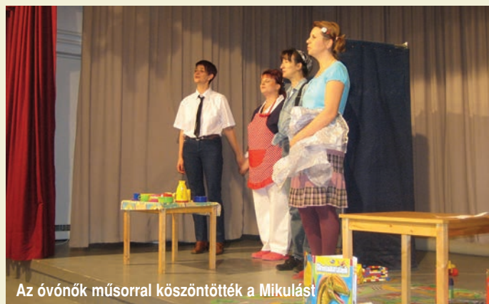
Az óvónők műsorral köszöntötték a Mikulást

Márton nap környékén „libás” hetet tartottunk. Meséltünk a gyere-