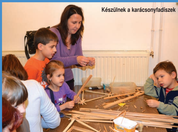
Készülnek a karácsonyfadíszek