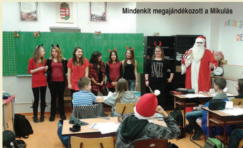
Mindenkit megajándékozott a Mikulás

A rendezvény nagyon jól sikerült, a bevételt egy rászoruló család kapta meg az „Életfa a gyermekekért” Alapítványon keresztül, valamint számtalan egyéb adomány is érkezett a számukra.