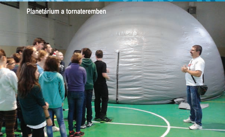
Planetárium a tornateremben

megnéztük a Schönbrunni királyi kastélyt. A kastély előtti adventi vásárran teljesen ráhangolódtunk a karácsonyra, számtalan finomságot kóstoltunk és szép kis ajándékokkal gazdagodtunk.