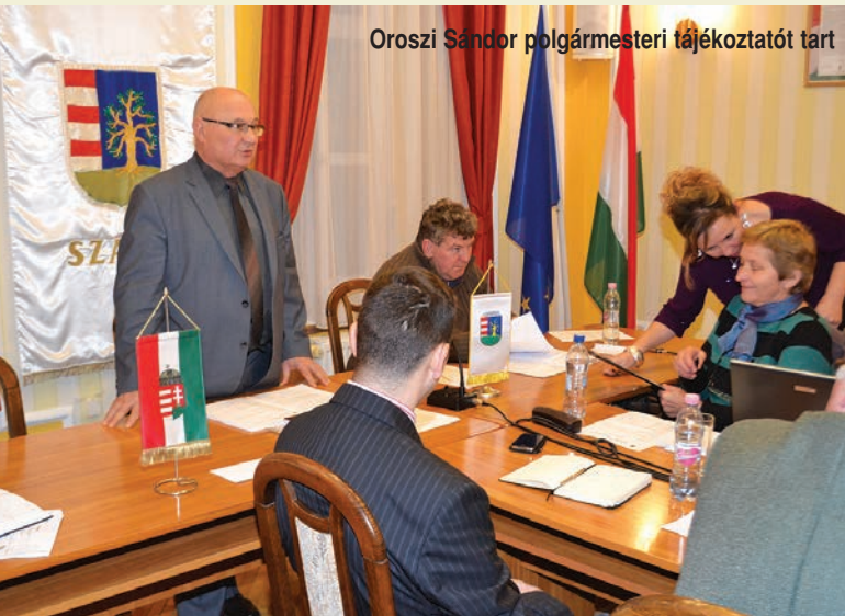
Oroszi Sándor polgármesteri tájékoztatót tart

Testületi ülésről jelentjük (december 11.)