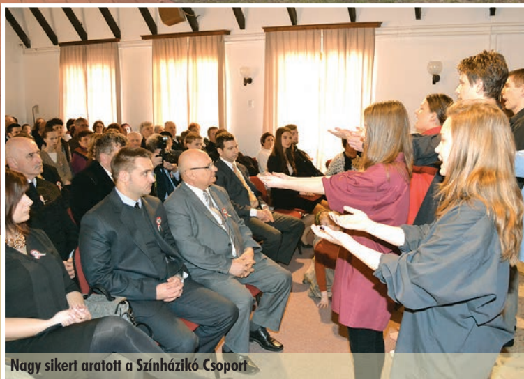
Nagy sikert aratott a Színházikó Csoport