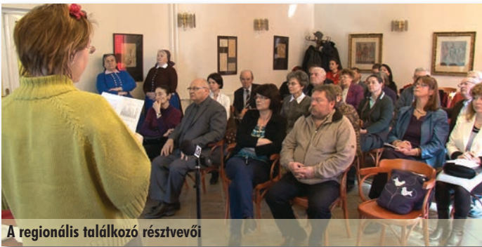
A regionális találkozó résztvevői

Március 6-án a Közérdekű Kulturális Alapítvány Szadaért és a Szadai Tájház rendezte meg a Magyarországi Tájházak Szövetsége Közép-Magyarországi Regionális találkozóját. A szakmai programokon mintegy 25 szakember vett részt a Faluházban.