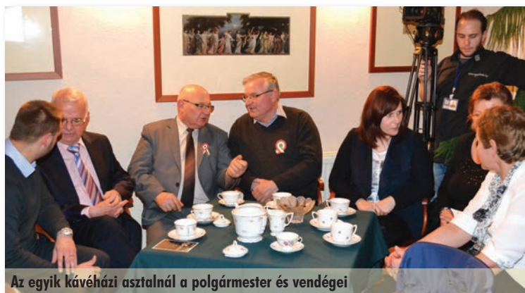
Az egyik kávéházi asztalnál a polgármester és vendégei