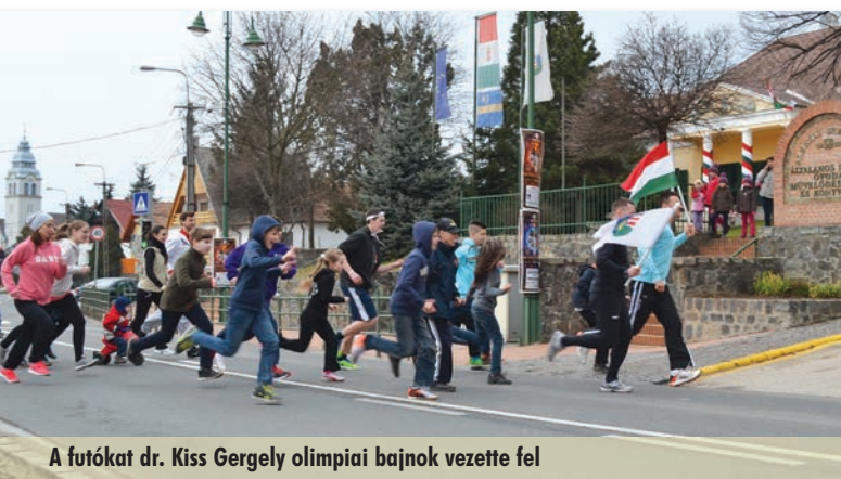
A futókat dr. Kiss Gergely olimpiai bajnok vezette fel