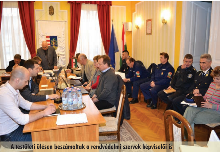
A testületi ülésen beszámoltak a rendvédelmi szervek képviselői is

300 ezer forint gyorssegély Nagydobronynak (Kárpátalja)