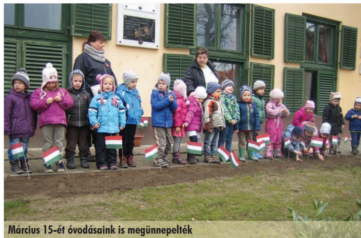
Március 15-ét óvodásaink is megünnepelték

A sorozat első programján testközelből ismerkedhettek a gyerekek és szülei a jövőbeli nevelőkkel, az óvoda épületével és az ott zajló mindennapokkal.