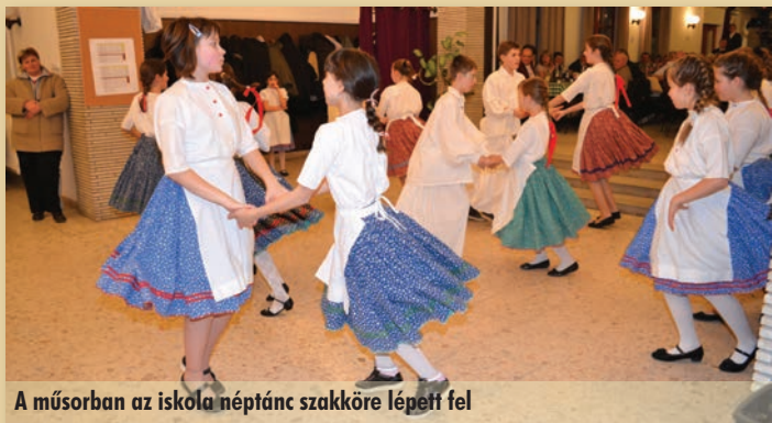
A műsorban az iskola néptánc szakköre lépett fel