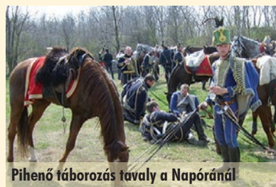
Pihenő táborozás tavaly a Napóránál

Az 1848–49. évi szabadságharcban, 1849. április 7-én Damjanich János III. hadteste elérte Szadát, ahol rövid pihenőt tartottak. Ennek emlékére 2015. április 7-én immár 27. alkalommal az Emlékhadjárat idén is megérkezik Szadára.