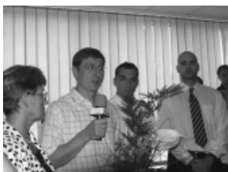
Gyurcsány Ferenc miniszter úr felavatja a Knézy Jenő sajtótermet