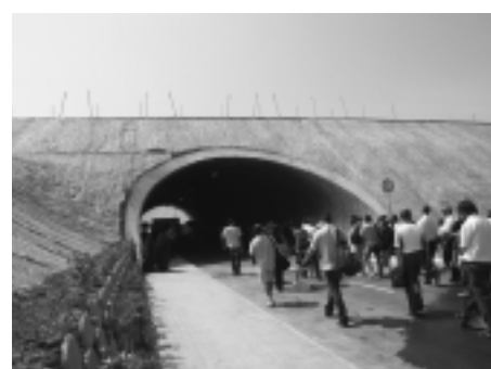
Az új alagút