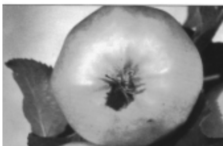
Az almamoly tojáscsomói

A szőlő zárópermetezésekor figyeljünk a szürkerothadásra, ne sajnáljunk egy drágább felszívódó szert. Permetezésére javasolom a TELDOR 500 SC-t.