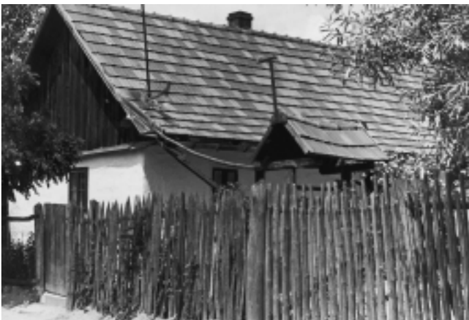
A szülői ház a Petőfi utcában

Fia, menyé reggel hattól délután négyig dolgozik. Közös portán van a házuk, Terike így napközben – főleg ilyenkor, nyáron – gondját viseli az unokáknak. Ötszáz négyszögöles a telek, bevetve, -ültetve kukoricával, krumplival, paradicsommal, papriká-